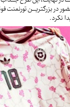
پیراهن دوم شیلی ادای احترام به طبیعت آتاکاما

این لباس با حال و هوای گرمسیری، رنگ های جسورانه و طراحی پر انرژی، می توانست یکی از متفاوت ترین و چشم نوازترین پیراهن های جام جهانی ۲۰۲۶ باشد. اما در نهایت، این طرح جذاب هرگز فرصت حضور در بزرگترین تورنمنت فوتبال جهان را پیدا نکرد.