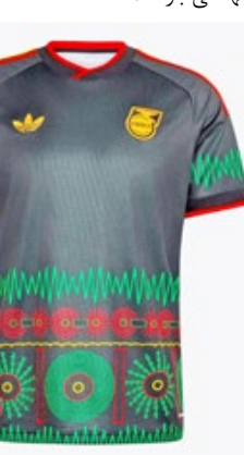
پیراهن دوم جامائیکا صدای باب مارلی روی لباس فوتبال جامائیکا تنها چند قدم با صعود به

پیراهن دوم شیلی با الهام از گل های وحشی صحرای آتاکاما طراحی شده بود؛ طرحی متفاوت که می توانست جلوه ای خاص به رقابت های جام جهانی ببخشد. اما این لباس، برخلاف زیبایی اش، سرنوشت چندان خوشی نداشت. شیلی در مرحله انتخابی جام جهانی در منطقه آمریکای جنوبی (کونمبول) عملکرد بسیار ضعیفی داشت و با قرار گرفتن در انتهای جدول، برای سومین دوره متوالی از رسیدن به جام جهانی بازماند.