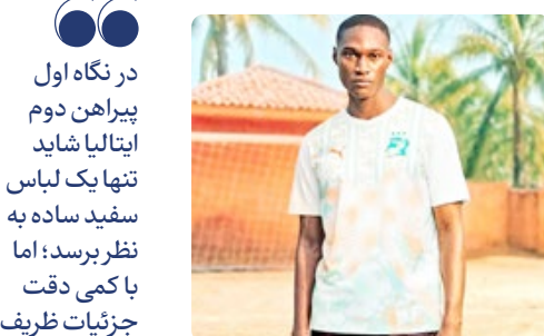
پیراهن دوم ساحل عاج رنگ هایی از هویت قیل ها

ترکیب سادگی، اصالت و حس کلاسیک باعث شده بود این لباس یکی از جذاب ترین پیراهن های جام باشد؛ پیراهنی که بدون شک شایسته حضور در بزرگترین صحنه فوتبال جهان بود، اما در نهایت تنها در فروشگاه ها دیده شد و نه در مستطیل سبز.