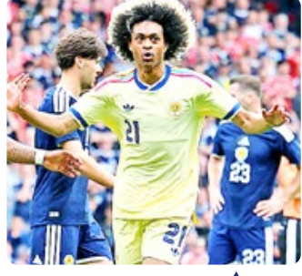
پیراهن دوم کوراسائو زیبایی ای که روی نیمکت ماند

در بعضی موارد این اتفاق چندان اهمیتی ندارد، اما گاهی باعث می شود برخی از زیباترین طراحی های جام جهانی حتی یک بار هم روی بزرگترین صحنه فوتبال جهان دیده نشوند. برای جبران این اتفاق، نگاهی داریم به پنج پیراهنی که با وجود جذابیت بالا، پیش از حذف تیم هایشان فرصت نمایش واقعی در جام جهانی ۲۰۲۶ را پیدا نکردند.