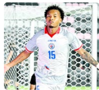
پیراهن های اصلی هائیتی فریانی تصمیم فیفا

ترکیب ظرافت، جزئیات مدرن و هویت بصری خاص، این لباس را به یکی از متفاوت ترین طراحی های جام جهانی تبدیل کرده بود؛ اما در نهایت، تنها در رختکن و فروشگاه ها باقی ماند و هرگز فرصت درخشش در بزرگترین صحنه فوتبال جهان را پیدا نکرد.