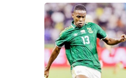
پیراهن دوم آفریقای جنوبی شاهکار آیداس که دیده نشد

تورنمنت فوتبال جهان فرصت دارد، ندیدن چنین پیراهنی در زمین، یکی از حسرت های زیبایی شناختی این جام خواهد بود.