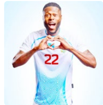
پیراهن دوم جمهوری دموکراتیک کنگو طراحی خاصی که فرصت پیدا نکرد

حذف زودهنگام تیم ملی برزیل از جام جهانی ۲۰۲۶ همچنان واکنش های گسترده ای را در این کشور به دنبال دارد. سلسا تو با شکست در مرحله یک هشتم نهایی برای نخستین بار از سال ۱۹۹۰ نتوانست به جمع هشت تیم برتر جهان راه پیدا کند؛ ناگامی ای که انتقادهای زیادی را متوجه کارلو آنچلوتی، سرمربی تیم ملی برزیل، کرده است.