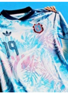
پیراهن دوم کاستاریکا طرحی گرمسیری که جام را از دست داد

همه داستان های جذاب لباس های جام جهانی به تیم های حاضر در تورنمنت محدود نمی شود. بعضی از کشورهای که از رسیدن به بزرگترین صحنه فوتبال جهان بازماندند، پیراهن هایی طراحی کرده بودند که می توانستند در خود جام بدرخشند.