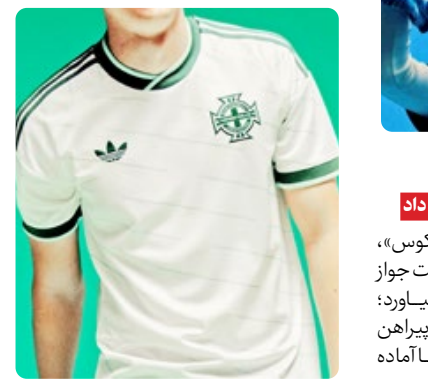
پیراهن دوم کاستاریکا طرحی گرمسیری که جام را از دست داد

طراحی پیراهن دوم شامل الگوهای شبیه موج های صوتی و گرافیک الهام گرفته از صفحه های وینیل موسیقی بود؛ لباسی که انگار می شد هنگام تماشايش، صدای آهنگ معروف «سرباز بوفالو» را شنید.