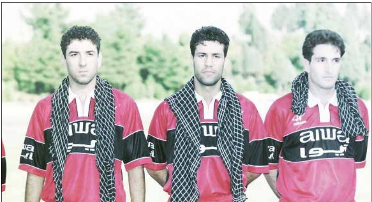
عکس باشگاه پرسپولیس

تارتار فوتبال ایران مستثنی نیست. مربیان داخلی یک امتیاز مهم دارد.