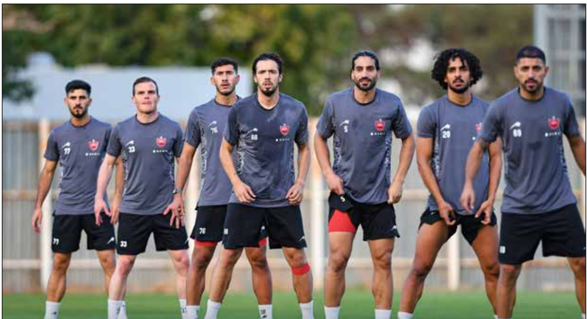
عکس باشگاه پرسپولیس

روش این است که با جذب بازیکنان خارجی با کیفیت به موفقیت برسیم.» این پیشکسوت پرسپولیس گفت: «همیشه حاضریم که با چشم‌انداز بسته به خارجی‌ها پول بدهیم در صورتی که می‌توانیم با جذب یک متخصص ضررها را کم کنیم. فوتبال ایران در سال‌های گذشته با جذب کیلویی بازیکنان خارجی متضرر شده است و هنوز هم این موضوع وجود دارد. مگر تا به حال چند فوتبالیست یا مربی خارجی خوب به پرسپولیس آمده است؟ اکثر آنها بی‌کیفیت بودند و پس از خروج از کشور باشگاه‌ها به پرداخت بدهی‌های سنگین محکوم کردند.»