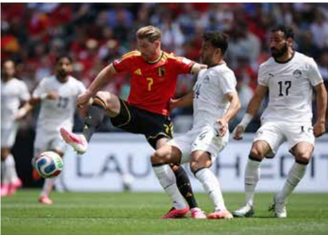
وامشپ با بلژیک بازی داریم.

آن تساوی شرایط را برابمان سخت کرد و حالا باید بلژیک را شکست دهیم. معمولاً در ۹۰درصد دوره‌هایی که در جام جهانی حضور داشتیم بازی اول ما ضعیف‌ترین و دیدار سوم ما بهترین بازی بوده است. بلژیک در تمام خطوط با حساب و کتاب بازی می‌کند. آنها در خط حمله بازیکنی دارند که کم‌تر تیمی مثل آن را دارد.