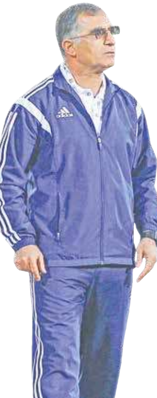
می‌شود توضیح بیشتری ارائه کنید؟

با تساوی در بازی اول شانس صعودمان کم شد. برای صعود باید با ترکیب بهتری به زمین می‌رفتیم. در نیمه دوم تغییراتی را انجام دادیم ولی کار سخت شده بود. ما برای برنده شدن اول نباید گل می‌خوردیم. آنها در اولین حمله دروازه ما را باز کردند و وقتی از حریف عقب می‌افتادیم کار ما سخت می‌شد. وقتی توپ را در اختیار داشتیم تیم خطرناکی بودیم اما وقتی توپ در اختیار ما نبود تیم آسیب‌پذیری نشان می‌دادیم. باید از بازیکنان خلاق و تکنیکی بیشتر استفاده می‌شد. اما هرچه بود آن بازی و دو امتیاز حساسش از دست رفت.