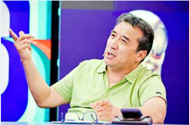
اقدام خودسرانه مدیرعامل بانک شهر

به موازات اعتراض هواداران، پیشکسوتان پرسپولیس هم در مصاحبه‌های خود از این خبر شگفت‌زده شده و البته به اتفاقی که رخ داده معترض شدند. پیشکسوتان پرسپولیس در مصاحبه‌های خود تأکید داشتند فردی که قرار است به عنوان مدیر تیم پرسپولیس فعالیت کرده و نقش ایفا کند حتماً باید عضوی