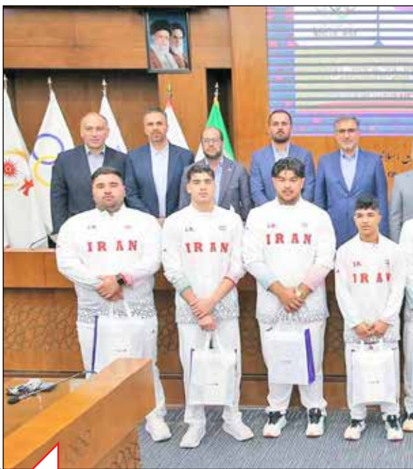
تیم ملی المپیک