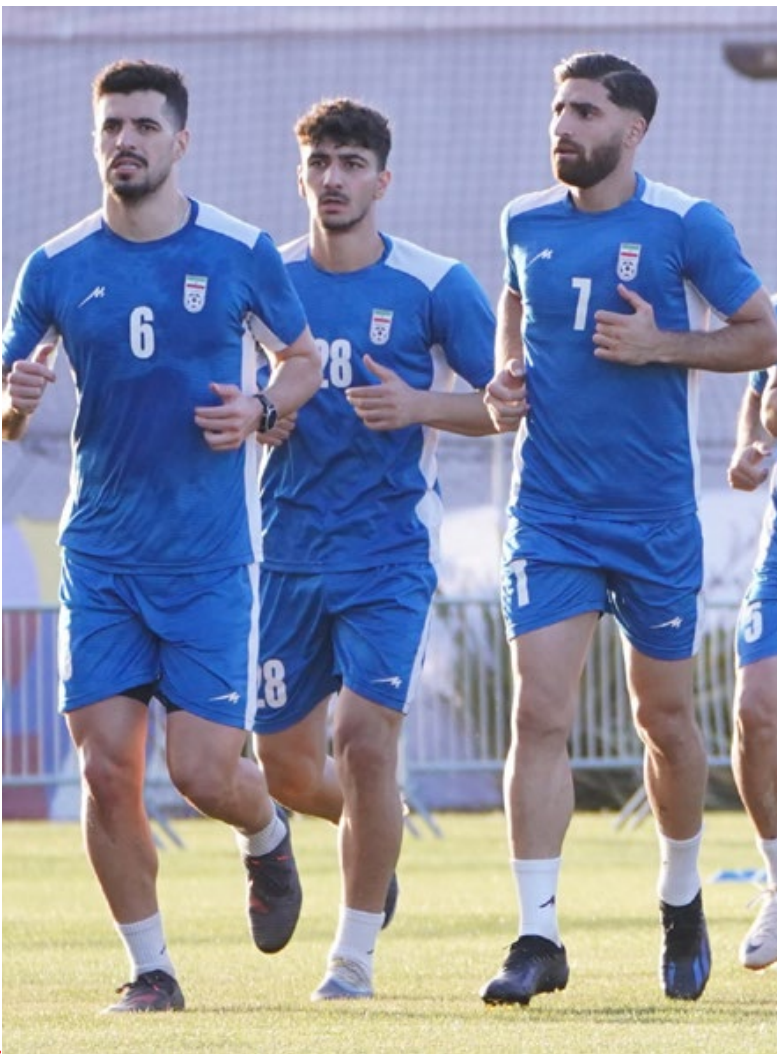
یکم. فدراسیون فوتبال

اکنون نشانه‌هایی وجود دارد که قلعه‌نویی نیز ممکن است در جام جهانی به همین مسیر نزدیک شود. تیم ملی ایران از نظر مهره‌های هجومی کمبودی ندارد. وینگرهای سرعتی، مهاجمان باکیفیت و بازیکنان تکنیکی در اختیار کادر فنی هستند. بنابراین شاید منطقی‌ترین تصمیم این باشد که ابتدا ساختار دفاعی تیم تثبیت شود و سپس از توانایی‌های هجومی موجود بهره‌برداری.