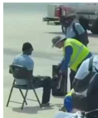
بازرسی بدنی بازیکنان تیم ملی فوتبال سنگال در فرودگاه