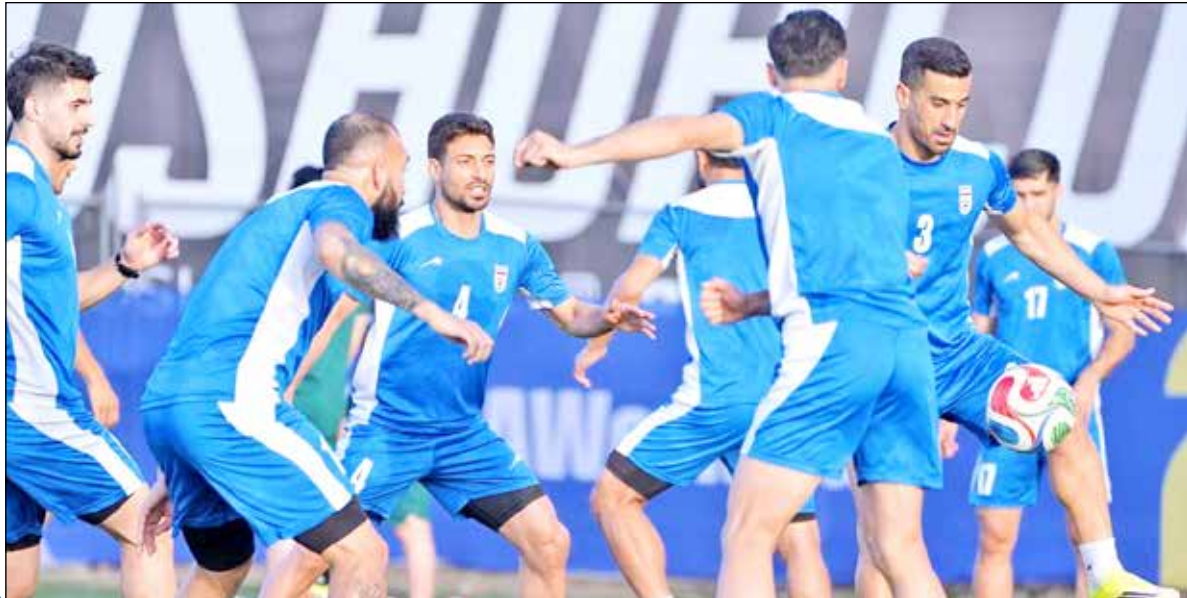
کمیته فدراسیون فوتبال

پیش‌بینی در فوتبال همیشه دشوار است، اما اگر بخواهید براساس شرایط فعلی نظر بدهید، کدام تیم را شانس اول قهرمانی می‌دانید؟ من آرژانتینی هستم، بنابراین طبیعتاً روی آرژانتین شرط می‌بندم. پس از آن، در فرانسه و اسپانیا بازی کرده‌ام و این دو تیم را هم جزو مدعیان اصلی می‌دانم. بنابراین انتخاب من این سه تیم هستند، هرچند می‌توان تیم‌های دیگری مثل برزیل، آلمان و پرتغال را هم به این فهرست اضافه کرد. و البته همیشه یک شگفتی در جام جهانی وجود دارد؛ هیچ‌کس نمی‌داند آن تیم کدام خواهد بود، اما مطمئناً یک غافلگیری بزرگ خواهد دید.