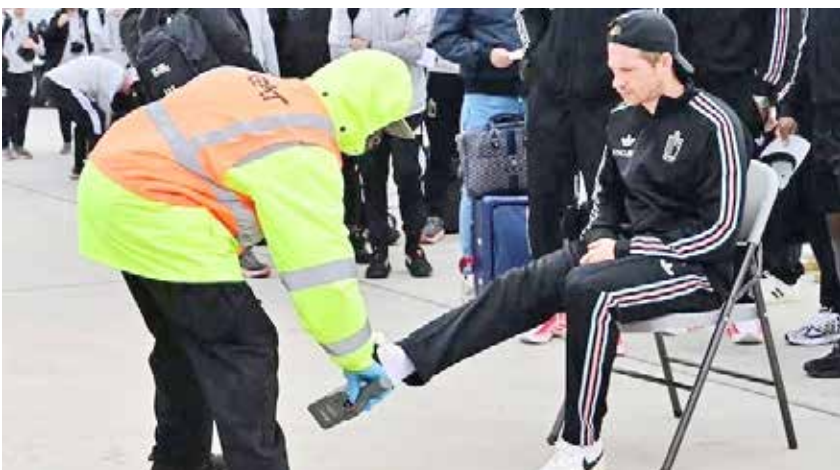
بازرسی بدنی دی بروینه بازیکن تیم ملی بلژیک