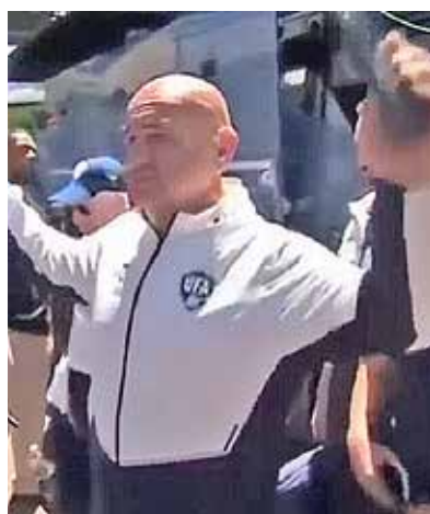
بازرسی بدنی تیم ملی از بنگلادش در بدو ورود به آمریکا