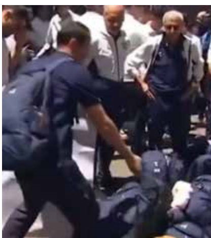
بازرسی وسایل تیم ملی از بنگلادش با سگ موادیاب