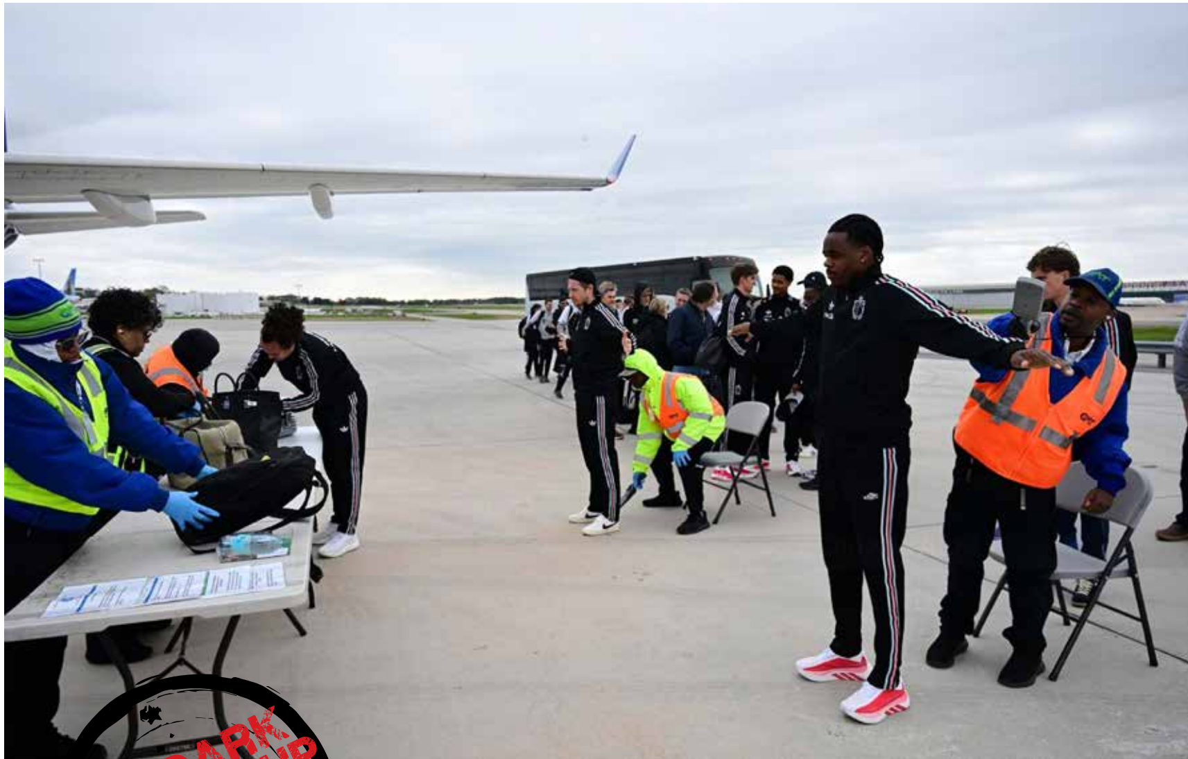
بازرسی بدنی بازیکنان تیم ملی فوتبال بلژیک در فرودگاه