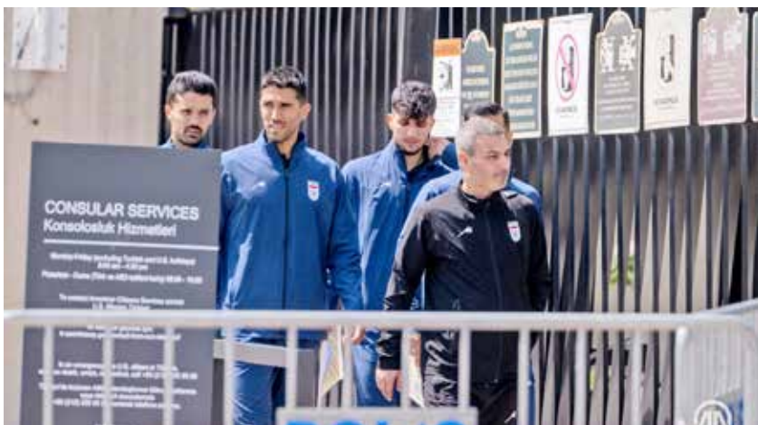
صدور روادید با تاخیر تیم ملی ایران در آنکارا و بازماندن ۱۵ نفر از همراهی تیم ملی به آمریکا