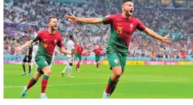
هت تریک گونسالو راموس مقابل سوئیس، ۲۰۱۰