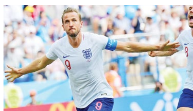
هت تریک هوری کین مقابل پاناما، ۲۰۱۸