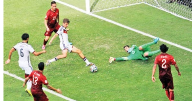
هت تریک فومس مولر مقابل پرتغال، ۲۰۱۴