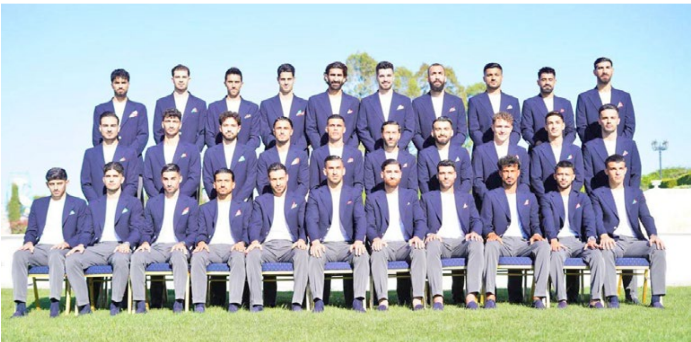
رئیس فدراسیون فوتبال ایران