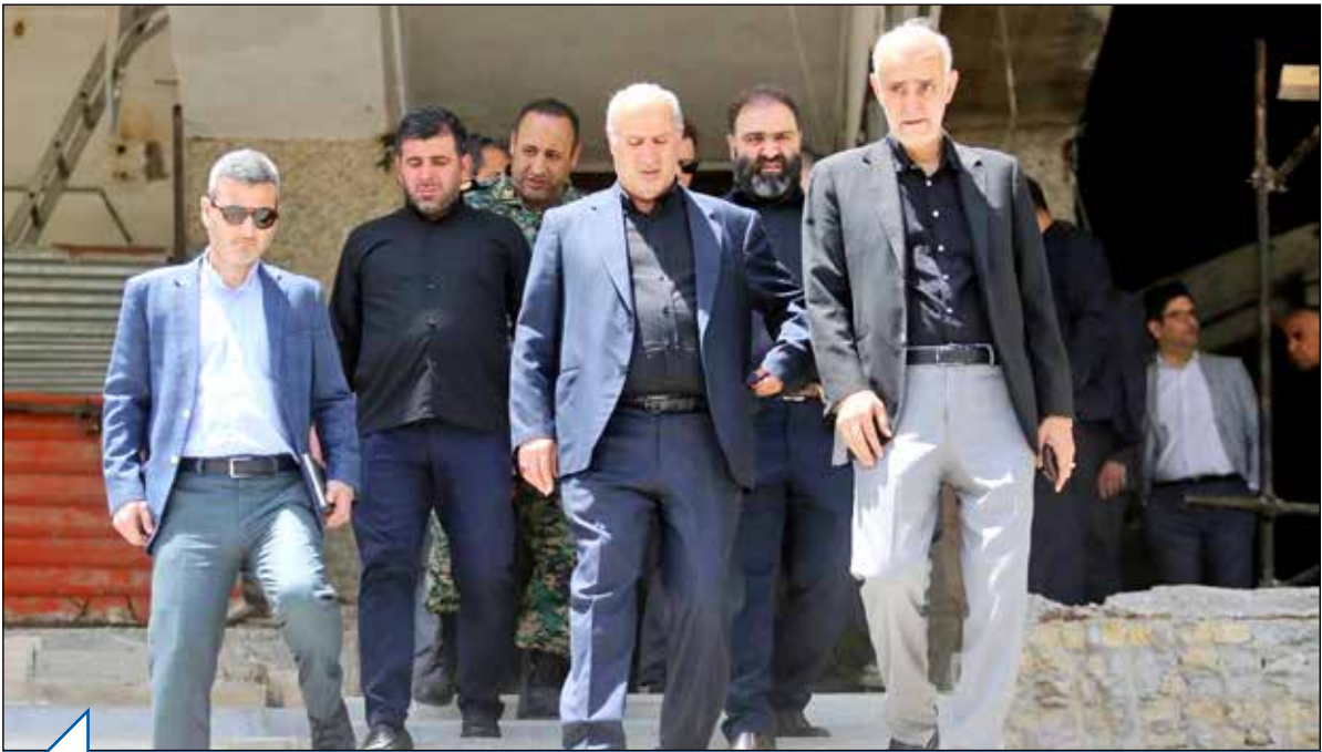
معضل بزرگ برای تمرین و کنفرانس قبل از بازی