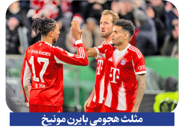
مثلث هجومی بایرن مونیخ

چیوو ۴۵ ساله که پس از شکست سنگین ۰-۵ اینتر مقابل پی اس جی در فینال سال گذشته، جانشین سیمونه اینزاگی شده بود، پاسخ سختی به منتقدانش داد. او نه تنها اینتر ویران شده را احیا کرد و اسکودتو را با اقتدار پس گرفت، بلکه جام حذفی ایتالیا را نیز فتح کرد تا به اولین مربی اینتر پس از ژوزه مورینیو (در فصل سه‌گانه تاریخی) تبدیل شود که هر دو جام داخلی را در یک فصل کسب می‌کند.