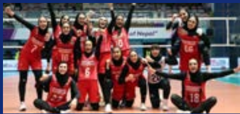
باشکست قاطعانه والیبالیستای ایران