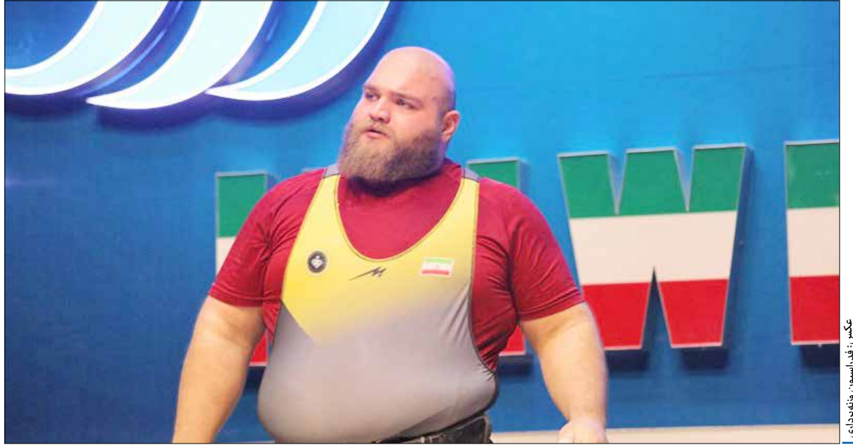
کسب فدراسیون وزنه‌برداری