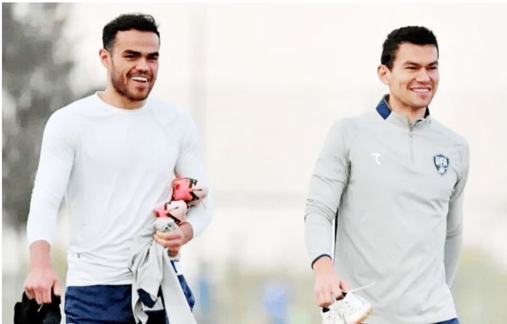
تیم ملی فوتبال ایران