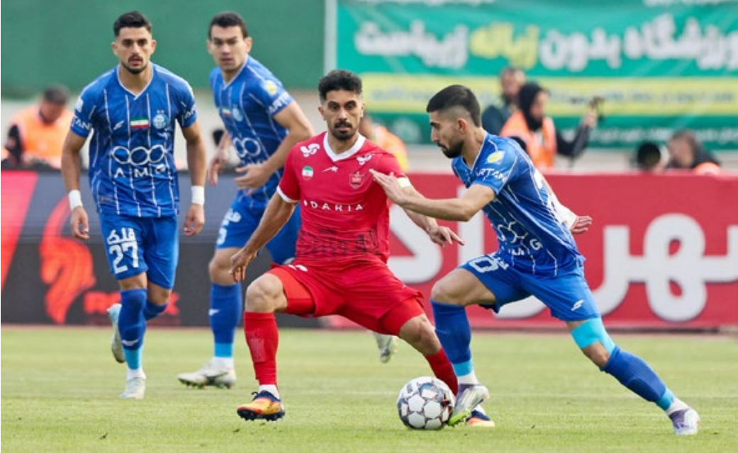
تکس: رضا معطریان / ایران