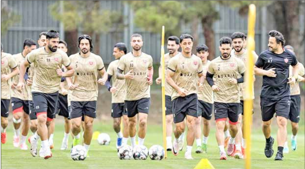
کسب باشگاه پرسپولیس