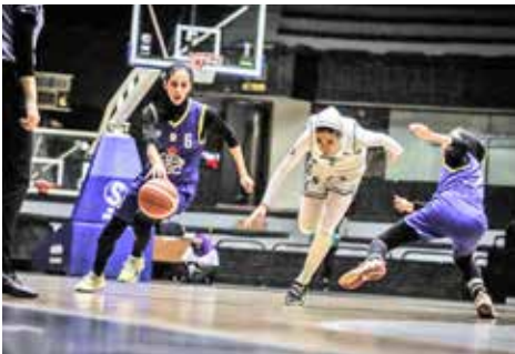
فینال لیگ برتر بسکتبال زنان ایران قرار بود عصر دیروز در شهر قدس برگزار شود؛ مسابقه‌ای که از هفته‌ها قبل به عنوان یکی از مهم‌ترین دیدارهای فصل شناخته می‌شد و قرار بود تکلیف

قهرمان را مشخص کند. اما آنچه در سالن رقم خورد، بیشتر شبیه یک سناریوی عجیب و غیرمنتظره بود تا یک فینال حرفه‌ای. دیداری که با عدم حضور تیم آکادمی سحر شروع نشد اما جام قهرمانی در پایان به دست بازیکنان استقلال رسید. طبق برنامه، تیم‌های استقلال تهران و آکادمی سحر باید در دومین بازی سری فینال لیگ برتر زنان مقابل هم قرار می‌گرفتند. استقلال که بازی اول را با پیروزی پشت سر گذاشته بود، تنها یک گام تا قهرمانی فاصله داشت و در سوی مقابل آکادمی سحر برای بازگرداندن امید به قهرمانی، نیازمند پیروزی بود. بازیکنان استقلال طبق برنامه وارد سالن شدند و منتظر شروع دیدار ماندند؛ اما هرچه زمان گذشت خبری از تیم آکادمی سحر نشد. غیبت کامل تیم مقابل در سالن باعث شد داوران و مسئولان اجرایی طبق آیین‌نامه، نتیجه را به سود استقلال اعلام کنند تا آبی‌پوشان بدون برگزائی مسابقه دوم، جام قهرمانی لیگ را بالای سر ببرند. این پایان عجیب فینال، واکنش‌های زیادی را در