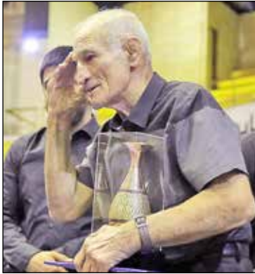
یادبودی برای موحد توسط کمیته ملی المپیک و فدراسیون کشتی