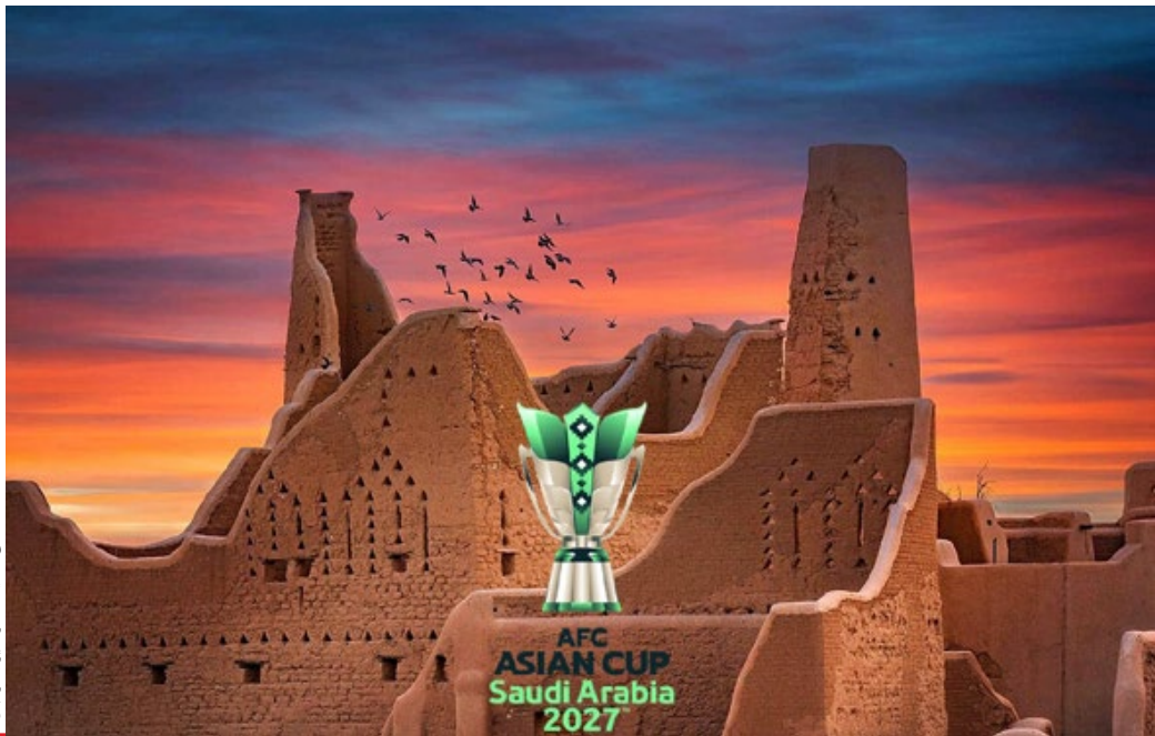
عکس سایت فدراسیون فوتبال

خود در رده بعدی قرار دارد. همچنین از میان ۳۳ تیم صعود کرده به این دوره جام ملت های لبنان و یمن که هنوز شانس حضور دارند، همه سابقه بازی در جام ملت های آسیا را داشته اند. به این ترتیب، دوره ۲۰۲۷ تنها سومین دوره تاریخ مسابقات خواهد بود که تمامی تیم های حاضر، تجربه قبلی حضور در این تورنمنت را دارند؛ اتفاقی که پیش تر