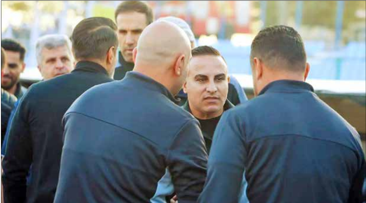
کعبی باشگاه استقلال