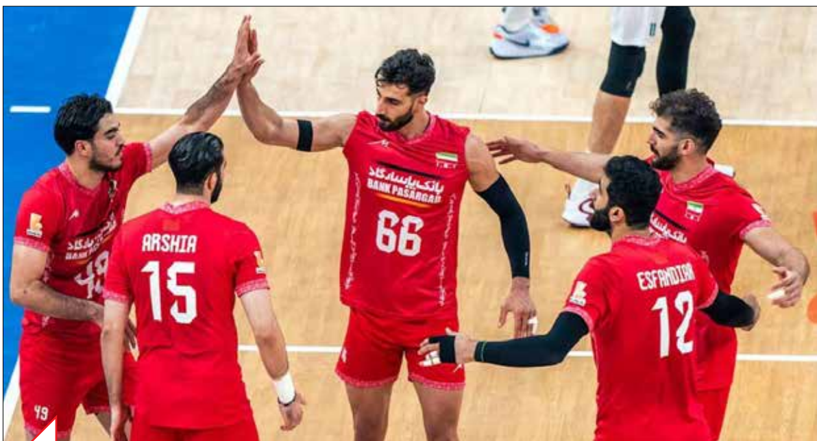
تیم فدراسیون والیبال

عبدالله موحد، تنها یک نام نیست؛ او یک مکتب است، یک اسطوره است، یک قهرمان ملی است که نامش تا ابد در سپهر پهلوانی ایران خواهد درخشید اما کاش می‌شد که این نایفه به ایران بیاید و تن نحیفش را خاک ایران به آغوش بگشود. دریفا که شرایط برای این امر مهیا نشد تا الماس کشتی ایران در خاک آمریکا دفن شود. او تا ابد از ایران و ایرانی‌ها دور ماند اما نام و یادش در دل همه می‌ماند.