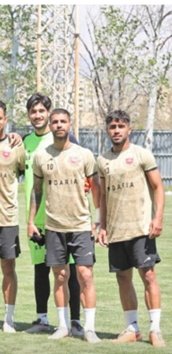
سکین باشگاه پرسپولیس

پرسپولیس می‌گوید چنانچه جنگ تحمیلی اخیر رخ نمی‌داد شرکت پرسپولیس در سال مالی ۱۴۰۵ زیان ده نبود و در سال مالی ۱۴۰۶ دیگر پرسپولیس پیش بردن برنامه‌های اقتصادی آنها این مهم کمی زمانبر خواهد بود و شاید از برنامه خود یک سال عقب بیفتند. با وجود این هیأت مدیره باشگاه پرسپولیس در تلاش است تا برنامه‌هایی که برای رونق اقتصادی باشگاه ریخته شده در نهایت باعث شود