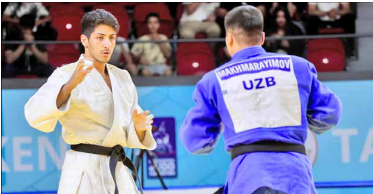
عکس: رقابت فدراسیون جودو

ارتقا دهد و آنان را برای میدان‌های مهم‌تر آماده کند. در واقع، شکست برابررقبای قدرتمند جهانی بخشی از فرآیند رشد و بازسازی تیم ملی است؛ مسیری که گاه حتی از کسب مدال در تورنمنت‌های کم‌اعتبار و