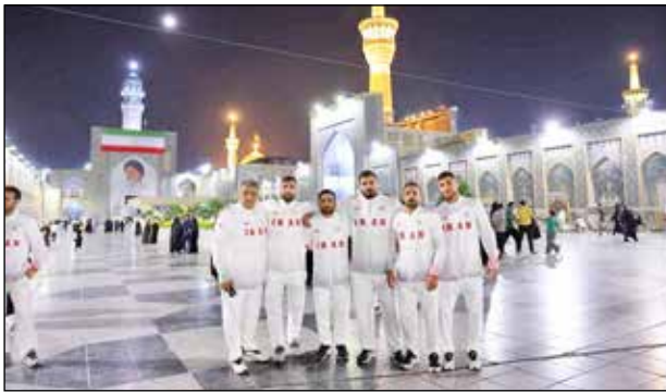
عکس: بازگشت مسافران سانیا

کاروان ورزشی ناو دنا پس از حضور موفق در رقابت‌های بازی‌های آسیایی ساحلی ۲۰۲۶ سانیا و کسب عنوان سوم این مسابقات، وارد مشهد مقدس شد و مورد استقبال مسئولان ورزشی و استانی قرار گرفت. اعضای این کاروان ورزشی در بدو ورود به مشهد، در هتل هما با استقبال جمعی از مسئولان حوزه ورزش و مدیریت شهری روبه‌رو شدند. در این مراسم، جمعی از مدیران ورزش استان، مسئولان شهری، علیرضا پاکدل رئیس فدراسیون هندبال و عضو هیأت اجرایی کمیته ملی المپیک، رئیس ورزش استان قدس رضوی و تعدادی از رؤسای هیأت‌های ورزشی استان حضور داشتند. کاروان ناو دنا در جریان بازی‌های آسیایی ساحلی سانیا، با عملکردی قابل توجه موفق به کسب مقام سوم شد و افتخاری دیگر را برای ورزش کشور به ثبت رساند. اعضای