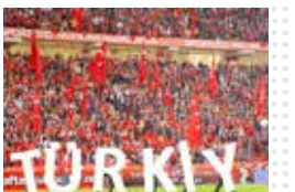
ترکیه چگونه از خاکستر ناگامی برخاست؟ ققنوس آتاتولی