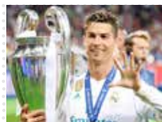
رونالدو فرهنگ ریاضت را جانداخت! راز ماندگاری نابغه