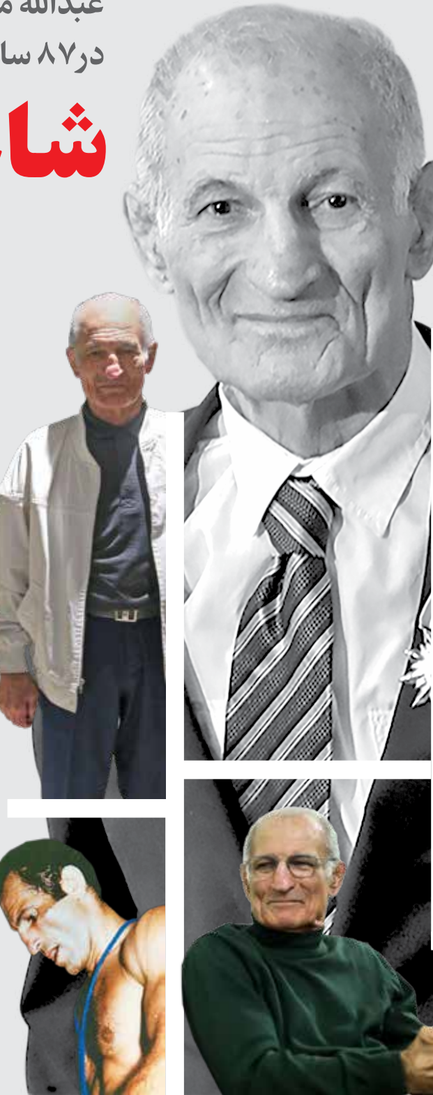
طرح: حامد حسینی