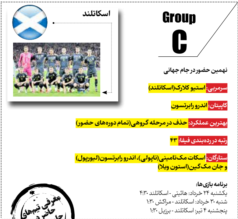
مهری تیم‌های حاضر در جام جهانی

بازگشت به روزهای اوج فوتبال اسکاتلند به عنوان یکی از کشورهای پیشگام در تاریخ این ورزش، همچنان در تلاش است تا به روزهای اوج خود بازگردد. با برنامه‌ریزی‌های درست، تیم ملی اسکاتلند می‌تواند در جام جهانی ۲۰۲۶ به عنوان یک تیم قدرتمند ظاهر شود. حمایت‌های پرشور طرفداران، تغییرات در ساختار تیم و حضور در رقابت‌های بزرگ جهانی می‌تواند مسیر جدیدی برای این کشور در دنیای فوتبال رقم بزند.