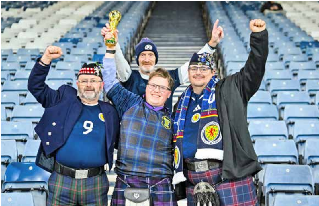
تیمی که هرگز به جایی نرسید، اما هیچ گاه تسلیم نشد