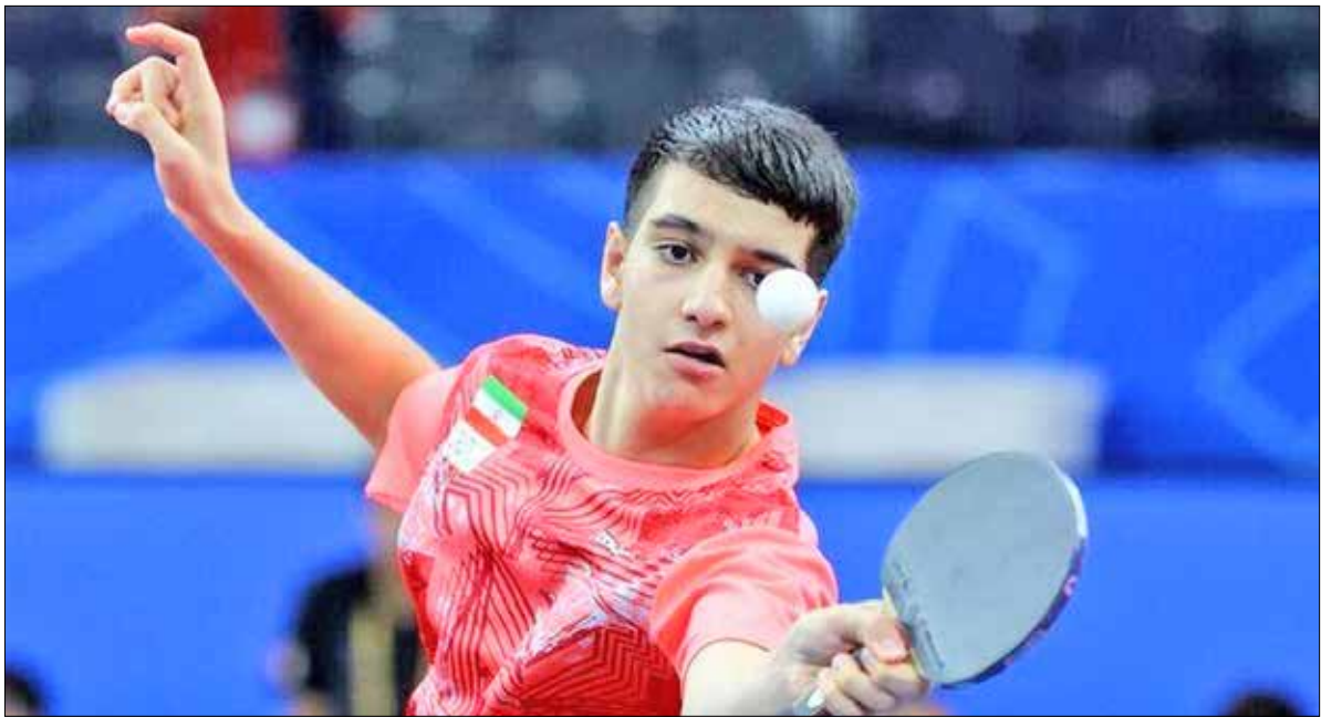
نگار: فخراسیون تنیس

بود آسیب جدی دید، دیگر شرایط برای ادامه تمرینات در تهران مهیا نبود. به همین دلیل با هماهنگی و حمایت فدراسیون تصمیم بر این شد چون امسال (۲۰۲۶) سال پرتزفیک و سختی را از نظر حضور در تورنمنت‌های معتبر گزینشی خصوصاً بازی‌های آسیایی ناگویا را پیش‌رو داریم، من ادامه تمریناتم را در کشور ژاپن دنبال کنم. به همین دلیل شرایط تمرینی‌ام در این کشور آسیایی فراهم شد تا حقیقتاً از اینکه موفق شدم سهمیه