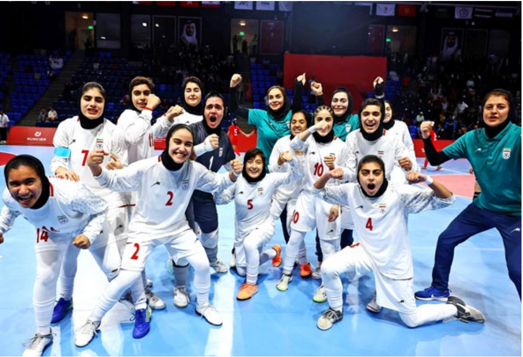
سوسون فوتبال