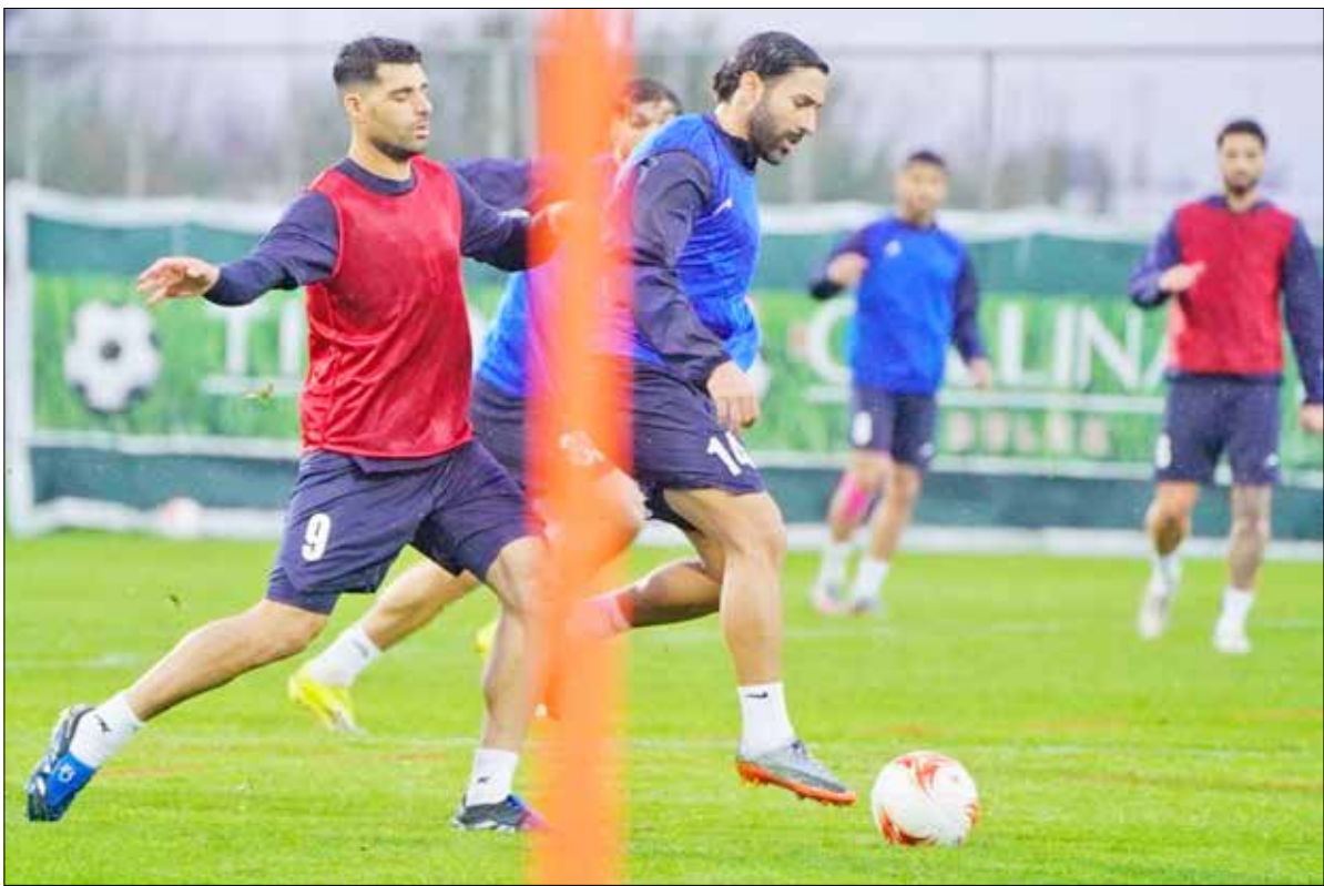
تیم ملی ایران در تمرین