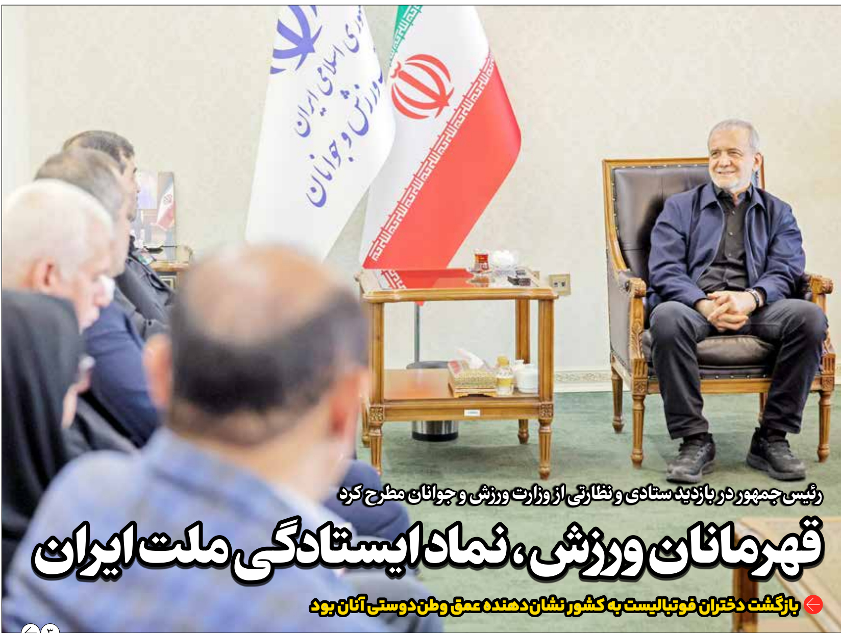
رئیس جمهور در بازدید ستادی و نظارتی از وزارت ورزش و جوانان مطرح کرد