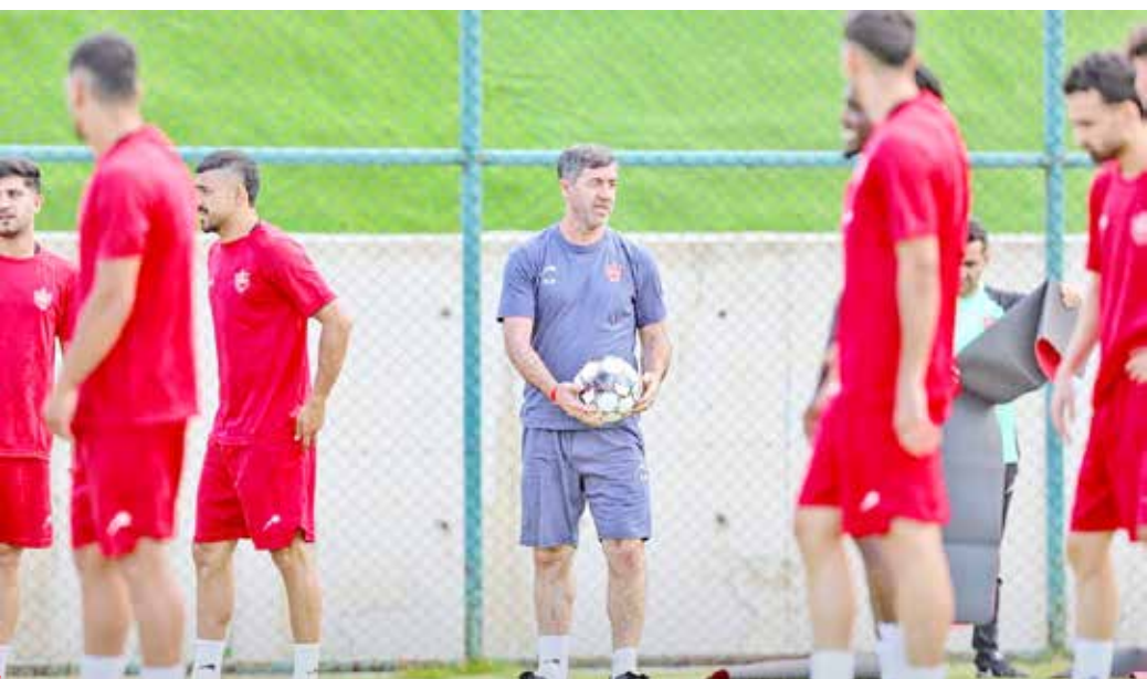
عکس باشگاه پرسپولیس

تمرین امروز قرار است زیر نظر کریم باقری آغاز شود اما در غیاب اوسمار ویرا و دستیاران خارجی اش که کم هم نیستند پرسپولیس مربی داخلی دیگری ندارد