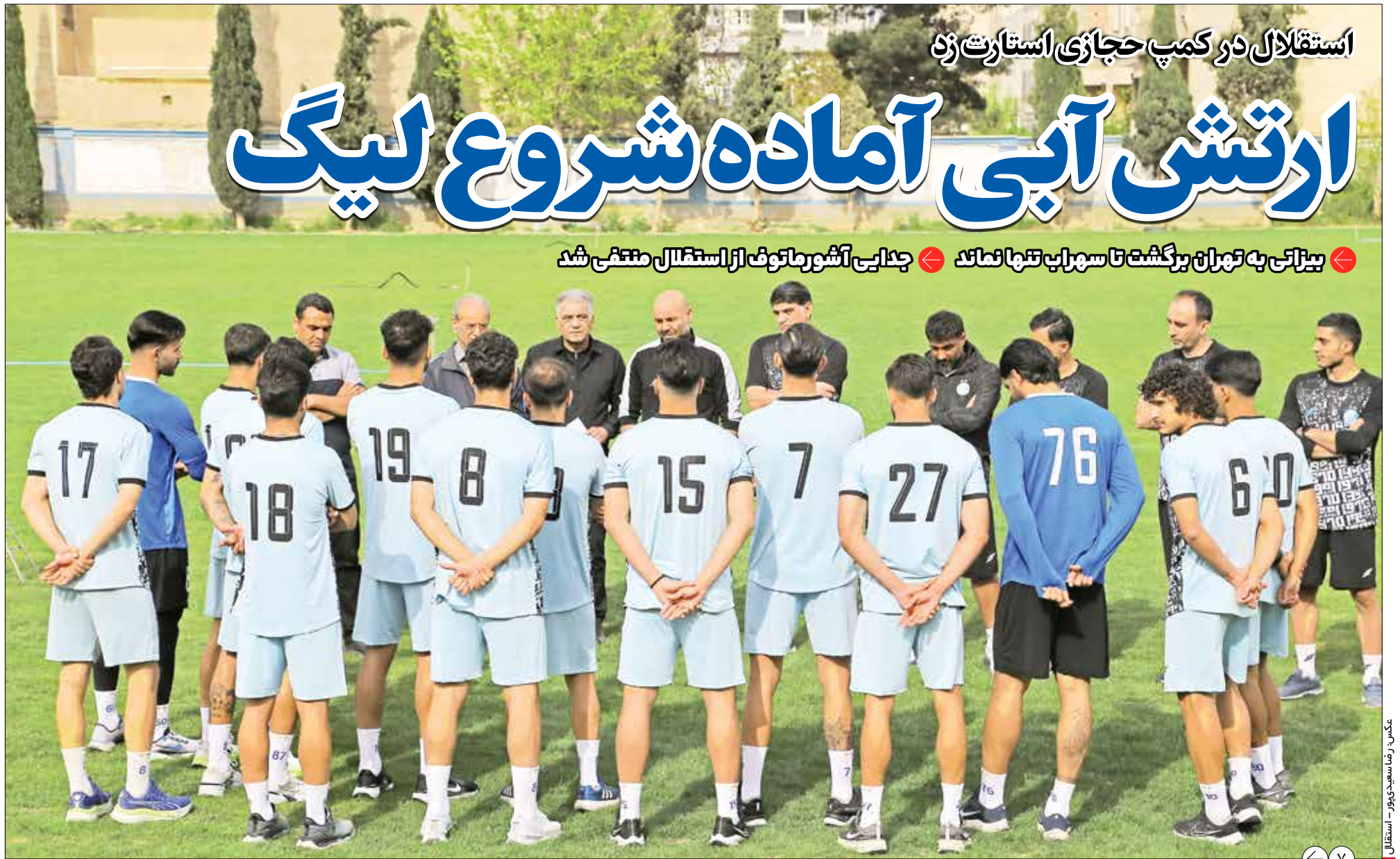
عکس: رضا سعیدپور - استقلال