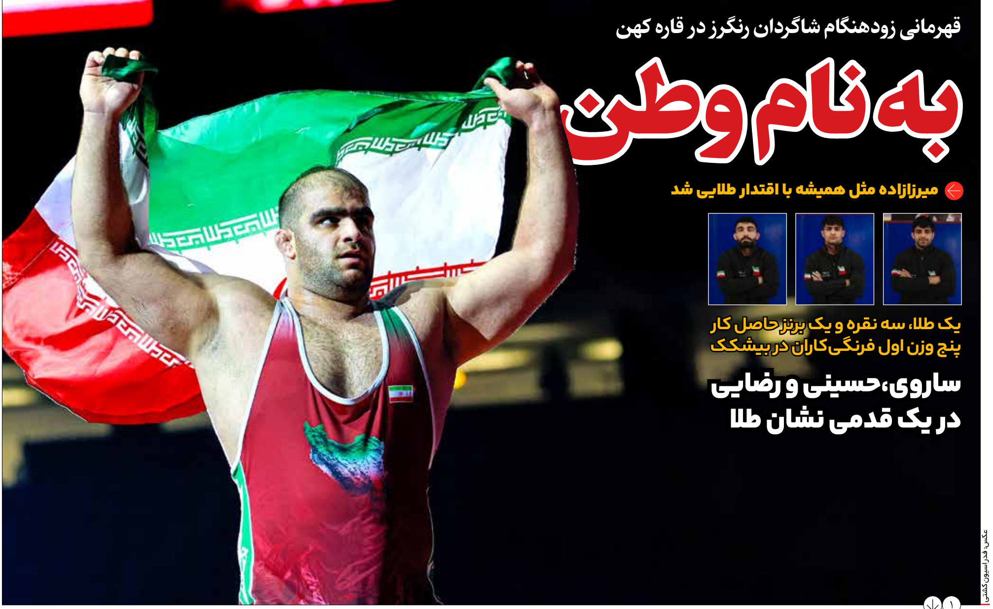
قهرمانی زود هنگام شاگردان رنگرز در قاره کهن

بازگشت به پارتیزان یا تمرین در اسکوپه؟ بلا تکلیفی یاسر آسانی در روزهای تعطیلی لیگ آیا ملی پوش آبی‌ها هم مثل ازبک‌ها رفتنی می‌شود