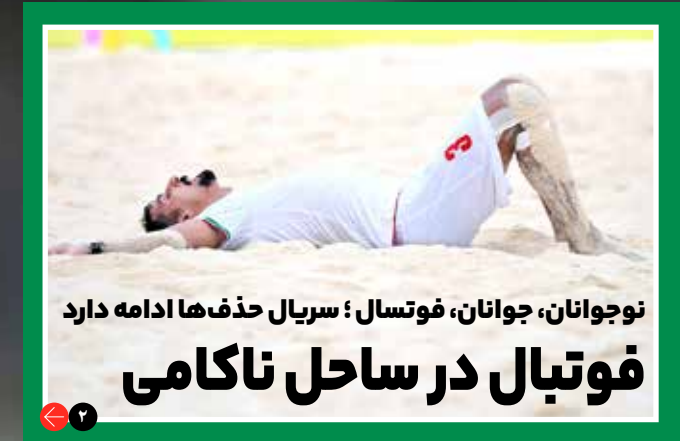
نوجوانان، جوانان، فوتسال؛ سریال حذف‌ها ادامه دارد فوتبال در ساحل ناکامی