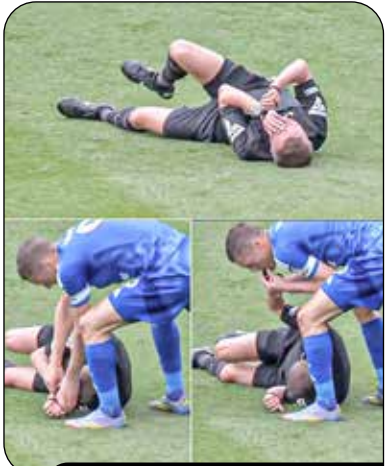
شغل جدید واردی

در حالی که در دقیقه ۲۱ مسابقه بین دو تیم لستر و ساوتهمپتون، لسترسیتی با گل جیمی واردی از ساوتهمپتون پیش بود، داور مسابقه پس از برخوردی که با جوردن آیو داشت، نقش بر زمین شد. در همین حال، جیمی واردی خودش را به وب رساند و با دمیدن در سوت او موجب توقف بازی و رسیدگی به وضعیت داور مسابقه شد.