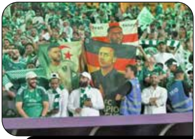
از خطر اخراج تا قهرمانی در آسیا

در ابتدای زانوپی گذشته، باشگاه الاهلی عربستان به‌طور موقت با ماسیمیلیانو آلگری به‌عنوان سرمربی فصل آینده به توافق رسید؛ تصمیمی که معنای آن پایان همکاری با ماتئاس یایسل، سرمربی آلمانی تیم، در پایان قراردادش در ژوئن ۲۰۲۵ بود. این تصمیم اما خیلی زود به گوش یایسل رسید و به شوکی بزرگ در روابط میان باشگاه و او تبدیل شد؛ گویی طرفین، بی‌نیاز از گذشت و تلاش، در مسیر جدایی قطعی قرار گرفته‌اند. اما در میانه همان ماه، جلسه‌ای سرنوشت‌ساز میان مدیریت باشگاه و یایسل برگزار شد، جلسه‌ای که روند داستان را به کلی تغییر داد. باشگاه با تجدید اعتماد به سرمربی آلمانی، او را تا پایان فصل و شاید حتی برای فصل آینده در سمتش حفظ کرد و این تصمیم در نهایت به یکی از بزرگترین افتخارات تاریخ باشگاه انجامید. قهرمانی در لیگ نخبگان آسیا. باشگاه الاهلی به پادشاهی رسمی اعلام کرد که یایسل به کار خود ادامه خواهد داد و در این بیانیه، به نقش تعیین‌کننده هواداران در موفقیت تیم نیز اشاره شد؛ حمایتی ریشه‌دار که نشان‌دهنده پیوند عمیق میان باشگاه و هوادارانش است. این اعتماد و اتحاد، انگیزه‌ای بی‌پایان برای ادامه مسیر افتخارآمیز و برافراشتن پرچم الاهلی در میادین داخلی و بین‌المللی شده است.