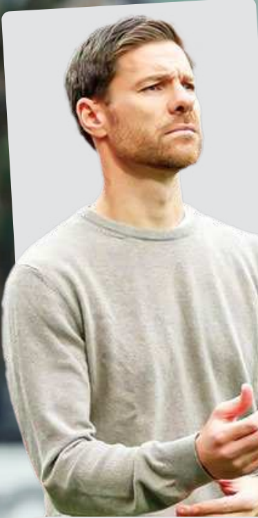
معرفی سرمربی جدید بعد از جام جهانی باشگاه‌ها