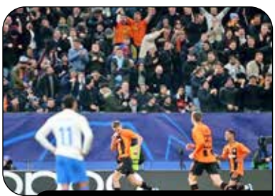
نخستین غیبت ساختار