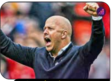
جوان ترین سرمربیان فاتح لیگ برتر انگلیس

آرئه اسلوت با سن ۴۶ سال و ۲۲۲ روز، ضمن عبور از پپ گواردیولا، چهارمین سرمربی جوان تاریخ لیگ برتر شد که به عنوان قهرمانی رسیده است. ژوزه مورینیو و کنی دالگلیش به ترتیب با قهرمانی همراه چلسی و بلکبرن، جوان ترین مربیان لیگ از این حیث به شمار می‌روند.