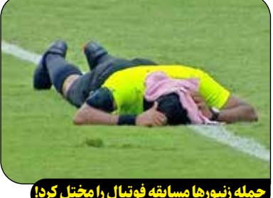
حمله زنبورها مسابقه فوتبال را مختل کرد!

حمله زنبورها بازی بمبئی سیتی و اینتر کاشی را مختل کرد. این دیدار جنجالی در چهارچوب مرحله یک چهارم نهایی سوپر جام ۲۰۲۵ هند برگزار شد. در دقیقه ۲۸ بازی زنبورها دسته جمعی به زمین بازی حمله کردند تا داور برای مدت ۴ دقیقه مسابقه را متوقف کند. بعد از ۴ دقیقه توقف، بازی مجدداً از سر گرفته شد اما این بار زنبورها پشت به کمک داور حمله کردند تا او را نقش بر زمین کنند و همه به کمک این داور آمدند ولی زنبورها دست بردار نبودند و در نهایت داوران مجبور به عوض کردن لباس بازی زد رنگ با سیاه شدند تا بعد از ۱۴ دقیقه توقف بازی مجدداً از سر گرفته شود.