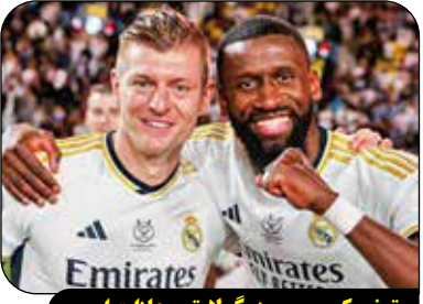
تونی کروس، رودیگر لایق مجازات است

پس از حواشی آنتونیو رودیگر در فینال کوپا دل ری، افراد زیادی نسبت به رفتار این بازیکن واکنش تندی نشان دادند. تونی کروس نیز نسبت به این اتفاق واکنش نشان داد و گفت: «رودیگر از اشتباهش آگاه است. او مجازات خود را دریافت خواهد کرد و این مجازات نیز کاملاً موجه خواهد بود. اما نباید طوری رفتار کنیم که انگار او کسی را کشته است.»