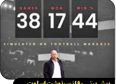
پیش بینی ۹۰٪ از سر نوشت اسلوت

صفحه رسمی رسانه مجازی ۹۰ دقیقه بعد از قطع شدن قهرمانی لیورپول یک پست منتشر کرد و نوشت: «ما آرئه اسلوت را به عنوان سرمربی لیورپول از ماه جولای شبیه سازی کردیم و پیش بینی می‌کردیم که بعد از یک فصل اخراج شود.»