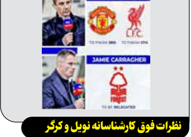
نظرات فوقی کارشناسان نوبل و کرگر

جیبی کرگر و گری نوبل قبل از شروع فصل ۲۰۲۴-۲۵ چند پیش بینی راجع به این فصل انجام داده بودند و حالا زمان مناسبی برای قضاوت تحلیل آنها است. در حالی که هنوز ۴ بازی تا پایان فصل ۲۰۲۴-۲۵ لیگ برتر انگلیس باقی مانده، از همین حالا تکلیف قهرمان و تیم‌های سقوط کننده به چپوشش‌پس مشخص شده است. قبل از شروع این فصل، گری نوبل و جیبی کرگر به عنوان دوتن از کارشناسان مطرح فوتبال انگلیس، گفته بودند ناتینگهام فارست سقوط می‌کند اما این تیم امسال در آستانه کسب سهمیه لیگ قهرمانان اروپا است.