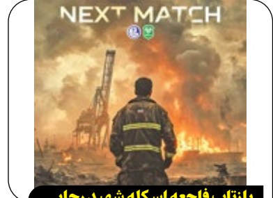
بازتاب فاجعه اسکله شهید رجایی