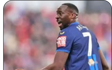
فوتبالیست قاتل به زندان افتاد

لوکاس آکینز، بازیکن تیم‌های لیگ یک فوتبال انگلیس، در دادگاه لیزب به دلیل قتل غیرعمد یک دوچرخه‌سوار در هادرزفیلد به ۱۴ ماه زندان محکوم شد. این حادثه ناگوار در مارس ۲۰۲۲ رخ داد. آکینز با خودروی خود تصادف کرد و آدریان دنیل، دوچرخه‌سوار ۳۳ ساله را زیر گرفت. متأسفانه آقای دنیل ده روز بعد در بیمارستان جان باخت. حکم صادر شده برای این فوتبالیست ۳۶ ساله، شامل ۱۴ ماه حبس بود که بخشی از آن به صورت بازداشتی پیش از موعد و بخش دیگر آن به صورت آزادی مشروط اجرا خواهد شد. علاوه بر این، آکینز به مدت یک سال از زندگی نیز منع شده است. آکینز در این فصل برای منسفیلد تاون در لیگ یک بازی می‌کند. پس از تصادف او با وجود اعتراف به گناه به بازی خود ادامه داده است. این فوتبالیست سابقه بیش از ۶۰۰ بازی در فوتبال خود در انگلیس و اسکاتلند و همچنین ۷ بازی ملی بزرگسالان برای ارکاندا دارد که جدیدترین آنها در شکست مقابل روسیه در ماه مارس است.