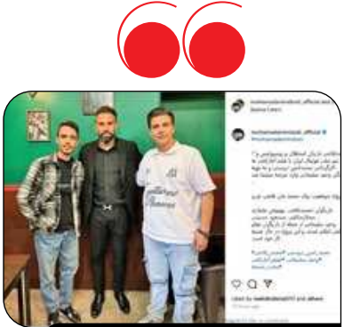
مهاجم سابق استقلال و پرسپولیس بازیگر شد

در شب پر حاشیه فینال کوپا دل ری، بارسلونا موفق شد با برتری ۳-۲ مقابل رئال مادرید به قهرمانی برسد. این دیدار در دقیق پایانی با تنش‌های زیادی همراه بود و آنتونیو رودیگر، مدافع آلمانی رئال مادرید، نقش پررنگی در این حواشی داشت. پس از این اتفاقات، رودیگر با انتشار متنی در شبکه‌های اجتماعی از رفتار خود ابراز پشیمانی کرد. او نوشت: هیچ توجیهی برای رفتارم وجود ندارد. واقعا متأسفم. ما از نیمه دوم بازی بسیار خوبی انجام دادیم، اما پس از ۱۱۱ دقیقه دیگر نتوانستیم به تیم کمک کنیم و قبل از سوت پایان، مرتکب اشتباهی شدم. بار دیگر از داور و همه کسانی که ناامیدشان کردم، عذرخواهی می‌کنم.