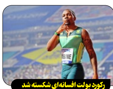
رکوردها بولت افسانه‌ای شکسته شد

آگاتی سیمبین، دوندۀ اهل آفریقای جنوبی، رکورد یوسین بولت جامائیکایی را برای تعداد فضولی که در آن ۱۰۰ متر را ۱۰ ثانیه دود، پشت سر گذاشت. سیمبین در مسابقات جایزه بزرگ طلایی در بوتسوانا توانست ۱۰۰ متر را در زمان ۹ ثانیه و ۹۰ صدم ثانیه طی کند و بازی دهمین فصل موفق شود. ۱۰۰ متر را زیر ۱۰ ثانیه بدود و از این حیث رکورددار شد. پیش از این یوسین بولت، سریع‌ترین انسان جهان، توانسته بود در ۱۰۰ فصل ۱۰۰ متر را زیر ۱۰ ثانیه بدود. سیمبین ۳۱ ساله دارنده مدال برنز مسابقات جهانی داخل سالن ۲۰۲۵ است و نکته چشمگیر در کارنامه ورزشی او ثبت شدن در سال‌های اخیر بوده است. در طرف مقابل بولت هشت مدال طلای المپیک و همچنین سه رکورد جهانی در ۱۰۰ متر، ۲۰۰ متر و ۴۰۰ متر در ۱۰۰ مترامدادی را در کارنامه دارد و به عنوان برترین دونده دوومیدانی تاریخ شناخته می‌شود. سیمبین، روزنامه‌نگار آفریقای جنوبی، در بازی‌های المپیک پاریس مدال نقره دوی ۴ در ۱۰۰ مترامدادی را به دست آورد. در دوی ۱۰۰ متر با ثبت رکورد ۹ ثانیه و ۸۲ صدم ثانیه به مقام چهارم دست یافت.