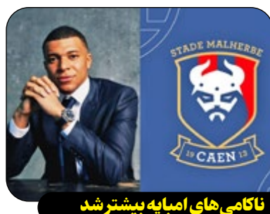
ناگامی‌های امیدیه بیشتر شد

کان فرانسه تحت مالکیت کیلیان امباپه روزهای خوبی را سپری نمی‌کند و آنها برای اولین بار در ۴۰ سال اخیر به سطح سوم فوتبال فرانسه سقوط کردند. این باشگاه که سال ۱۹۱۳ در منطقه نورماندی فرانسه تأسیس شد، بخش قابل توجهی از تاریخ ۱۱۱ ساله خود را به عنوان باشگاهی آماتور سپری کرده است. کان از سال ۱۹۸۵ به باشگاهی در سطح حرفه‌ای فوتبال فرانسه تبدیل شد. به گزارش اپتا، باشگاه کان ۳۰ سال پس از اینکه در فصل ۸۴-۱۹۸۳ از لیگ دوم فرانسه به لیگ اول صعود کرد، بار دیگر به سطح سوم فوتبال فرانسه (لیگ ملی) سقوط کرد. آنها در طول این دهه‌ها بیشتر باشگاهی آسانسوری بین دسته اول و دوم فوتبال فرانسه بودند. آخرین حضور کان در لیگ یک فرانسه به سال ۲۰۱۹ برمی‌گردد، جایی که برای پنج فصل در بالاترین سطح فوتبال فرانسه حضور داشتند و سپس به لیگ ۲ سقوط کردند. کان فصل گذشته را در رده ششم لیگ ۲ به پایان رساند، اما در فصل جاری افت عجیبی داشت. در اولین فصلی که امباپه به سهامدار اصلی این باشگاه تبدیل شد، کان با کسب ۲۱ امتیاز از ۳۱ بازی، در فاصله سه هفته به پایان فصل، شاهد قطعی شدن سقوطش به سطح سوم فوتبال فرانسه است.