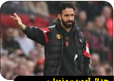
جدال آموریم و نویل: