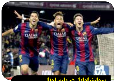
سوارز: اوایل در بارسلونا