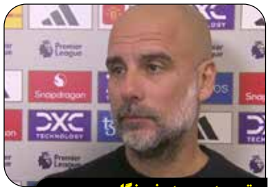
نویس پپ به خبرنگار: