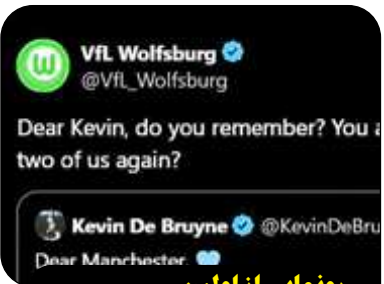
رونمایی از اولین مشتری دی پروینه

کوین دی پروینه از تصمیم خود برای جدایی از منچستر سیتی خبر داد. دی پروینه ۳۳ ساله که ۱۰ سال قبل و پیش از انتقال به منچستر سیتی برای وولفسبورگ بازی می کرد، دوباره علاقه این تیم را به خودش جلب کرده است. حساب رسمی باشگاه وولفسبورگ خطاب به دی پروینه نوشت: «کوین عزیز، یادته؟ من و تو ۱۰ سال قبل؟ نظرت در مورد کنار هم بودن دوباره ما چیه؟»