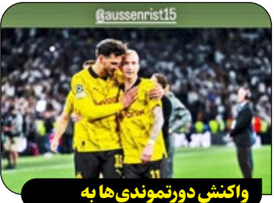
واکنش دورتموندی ها به بازنشستگی هوملس

متس هوملس، مدافع ۳۶ ساله آس رم، اعلام کرد که در پایان فصل جاری بازنشسته خواهد شد. خداحافظی هوملس از دنیای فوتبال، با واکنش های زیادی همراه بوده و بسیاری، این مدافع آلمانی را به سبب دوران حرفه ای باشکوه و کارنامه پرپراکنده دارد، مورد تقدیر قرار دادند. باشگاه بوروسیا دورتموند در واکنش به بازنشستگی متس هوملس بیانیهای منتشر و به او ادای احترام کرد: «یکی از بزرگترین بازیکنان تاریخ باشگاه ما این تابستان بازنشسته می شود. ما به پاس دوران حرفه ای بی نظیری که هوملس داشت، به او ادای احترام می کنیم.» مارکو روئیس در مورد بازنشستگی هم تیمی سابقش نوشت: «چه سفری! تبریک می گویم. بهترین ها را برای آینده ات آرزو می کنم.»