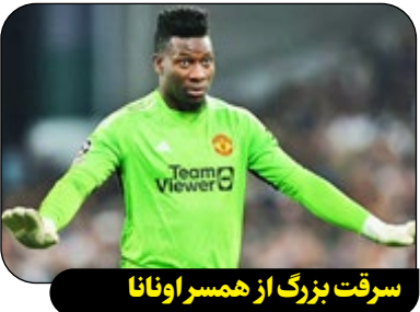
سرقت بزرگ از همسر اوانا

بر اساس گزارش ها، همسر آندره اوانا، دروازه بان تیم منچستر یونایتد، در بیرون یک رستوران ایتالیایی هدف سرقت قرار گرفته است. گفته می شود که این سارق کیف همسرش را که ارزش ۶۲ هزار پوند و همچنین یک ساعت رولکس را که هر دو متعلق به همسر اوانا بودند، به سرقت برده است. سارق پیش از دستگیری روز جمعه در دادگاه ماگستریت چستر حاضر شد و علاوه بر اتهام سرقت، با اتهام فروش مواد مخدر نیز مواجه است. قرار است او در ماه مه دوباره در دادگاه عالی چستر حاضر شود. خانم کامیو اغلب عکس هایی از سبک زندگی لاکچری خود را با کیف های برنده های لوکس از جمله پیرکین ژست منتشر می کند؛ کیف هایی که یکی از کمیاب ترین و پرتقاضاترین کیف های جهان به شمار می روند.