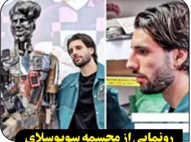
رونمایی از مجسمه سوپوسلاوی که شبیه او نبود

سوپوسلاوی پس از رونمایی از مجسمه ای که شباهتی به او نداشت، کاملاً حیرت زده شد. این مجسمه که توسط شرکت مخابراتی مجارستانی Magyar Telekom ساخته شده بود، در واقع بخشی از دروغ روز اول آوریل بود و بعد از رونمایی، هافبک تیم ملی مجارستان و باشگاه لیورپول طوری شوکت زده شد که تصویرش در فضای مجازی بشدت وایرال شد.