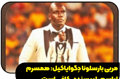
هری بارسلونا دگواپایکیل: همسر لاسمار رایسنند، کافی است

در دیدار بارسلونا دگواپایکیل مقابل تیم کورینتیانس که ممفیس دبیپای در آن حضور دارد، اتفاقی رخ داد که توجه همه را جلب کرد، مردم به جای توجه به نتیجه بازی، نگاهشان روی نیمکت تیم بارسلونا بود، جایی که مربی محلی، سگوندو کاستیو، با یک کت سفید همراه با شلوار مشکی و پاپیون ظاهر شده بود، چیزی که بیشتر مناسب یک عروسی بود تا یک مسابقه فوتبال و به همین دلیل بلافاصله در فوتبال جهان پربازدید شد. این مربی در خصوص انتخاب این ظاهر عجیب بعد از بازی در جمع رسانه‌ها گفت: «زنان در این مسائل دقت بیشتری دارند و همیشه به جزئیات توجه دارند. همسرم کسی است که به من کمک می‌کند تا لباس انتخاب کنم و بپوشم.»