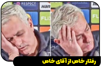
رفشار خاص از آقای خاص

فترباغچه در چهارچوب دیدارهای مرحله یک هشتم رقابت‌های لیگ اروپا در ورزشگاه خانگی و با حمایت هوادارانش روبروی گلاسکو رنجرز به میدان رفت و با نتیجه ۳-۱ در این بازی شکست خورد تا کارش برای صعود به مرحله بعدی دشوار شود. مورینیو در جریان نشست خبری پس از این بازی وانمود کرد که خوابش برده است. این سرمربی پرتغالی که پس از شکست تیمش با وجود ۲۳ شوت در چهارچوب ناامید شده بود، زمانی که خبرنگاری برای مدتی طولانی به زبان ترکی صحبت می‌کرد، وانمود کرد که روی صندلی اش خوابیده است.