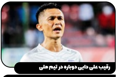
رتیب علی دانی دوباره در تیم ملی

بازگشت چهارمین گلزن برتر تاریخ فوتبال ملی سونیل چتری، بهترین گلزن تاریخ فوتبال هند که یک سال پیش از فوتبال ملی خداحافظی کرده بود، با ۴۰ سال و ۷ ماه بار دیگر به تیم ملی هند دعوت شد. او با ۹۴ گل ملی در ۱۵۰ بازی پس از کریستیانو رونالدو، لیونل مسی و علی دایی در رده چهارم بهترین گلزنان ملی جهان قرار گرفته و ۱۵ گل تا رسیدن به علی دایی فاصله دارد.