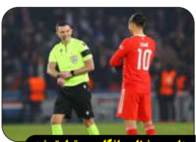
داور سرنشانی انگلیسی تعلیق شد

جنگال های یک خطای وحشتناک در جام حذفی انگلیس که در بازی میوال و کریستال پالاس اتفاق افتاد، همچنان ادامه دارد. دروازه بان میوال، لیام رابرتز با پرشی بلند و به سبک تکواندوکارها ضربه ای شدید به سر ژان فیلیپ ماتتا بازیکن حریف وارد کرد که باعث شد سر او ۲۵ بخیه بخورد. مایکل اولیور که قضاوت بازی را بر عهده داشت ابتدا از نشان دادن فوری کارت قرمز به دروازه بان میوال خودداری کرد و همین باعث شد انتقادات زیادی از او بشود. در همین راستا اتحادیه فوتبال انگلیس اولیور را به دلیل مدیریت ضعیف در این صحنه به حالت تعلیق درآورد و نام او در فهرست جدید داوران انگلیسی که قرار است این هفته سوت بزنند دیده نمی شود.