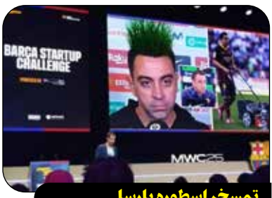
تمسخر اسطوره بارسا

حاشیه تازه ای در جریان یکی از رویدادهای باشگاه بارسلونا خبرساز شده است. شرکت Turfcoach، که مسئول آماده سازی چمن جدید ورزشگاه اسپانیای نیوکمپ است، در جریان یک ارائه رسمی، تصاویری را به نمایش گذاشت که به نوعی ژاوی، سرمربی بارسلونا، را مورد تمسخر قرار می داد. این اقدام باعث واکنش های زیادی در شبکه های اجتماعی شد و انتقاداتی را به دنبال داشت. عده زیادی از هواداران بارسا معتقدند با چنین تصویری ساختگی، به اسطوره شان توهین شده است.