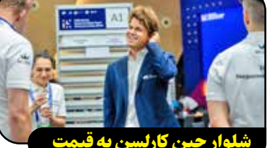
شلوار جین کارلسن به قیمت ۳۶ هزار دلار فروخته شد

مگنوس کارلسن، نابغه نروژی دنیای شطرنج یکی از مطرح‌ترین نام‌های تاریخ این رشته است. کارلسن در سال ۲۰۱۳ با شکست دادن ویسواناتان آتاند، قهرمان شطرنج جهان شد و این عنوان را تا سال‌های زیادی در اختیار داشت. مگنوس کارلسن، شانزدهمین قهرمان شطرنج جهان شلوار جینی را که به دلیل پوشیدن آن از مسابقات قهرمانی جهان محروم شده بود، در یک حراجی به قیمت ۳۶,۱۰۰ دلار فروخت. این استاد بزرگ نروژی این خبر را در صفحه شخصی خود در شبکه اجتماعی ایکس اعلام کرد و پیش‌تر نیز گفته بود که عواید حاصل از فروش آن صرف امور خیریه خواهد شد. در ژانویه ۲۰۲۵ کارلسن به دلیل عدم رعایت پوشش رسمی مسابقات از حضور در مسابقات جهانی سریع نیویورک (امریکا) منع شد. او با پوشیدن شلوار جین در مسابقات شرکت کرده بود که مغایر با قوانین بود. بان نیومینیچی، استاد بزرگ روسی نیز به دلیل تخلف مشابه توسط داور ارشد مسابقات قهرمانی جهان ۲۰۰ دلار جریمه شد.