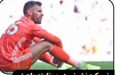
نیمکت نشینی در یونایتد باعث افسردگی من شد

بن فاستر، دروازه‌بان دوم سال‌های نه‌چندان دور منچستریونایتد، بعد از پانزده سال اعتراف کرد که نیمکت‌نشینی در اولدترافورد منجر به افسردگی شدیدی او در آن دوران شده بود. فاستر که از سال ۲۰۰۵ تا ۲۰۱۰ در منچستریونایتد حضور داشت و به نیمکت نشین دائم ادوین فن درسار تبدیل شده بود، درخصوص آن دوران گفت: «من با رؤیای تبدیل شدن به دروازه‌بان‌های افسانه‌ای یونایتد همچون پیتر اشمایکل به این تیم آمدم اما اوضاع آنطور که فکر می‌کردم، پیش نرفت. نیمکت‌نشینی متوالی باعث شد تا به قدری ضعیف و افسرده تبدیل شوم چرا که دیگر نمی‌توانستم فشارها را تحمل کنم. در همان بازی‌های کم‌تعدادی که درون دروازه قرار گرفتم نیز همواره استرس آن را داشتم که دچار اشتباه منفی نشوم و همین موضوع روی عملکردم تأثیر مشکلات من را می‌دانست و در نهایت تصمیم به ترک منچستریونایتد گرفتم. راستش را بخواهید احساسات تلخی که در آن دوران داشتم را هرگز در زندگی تجربه نکردم.»