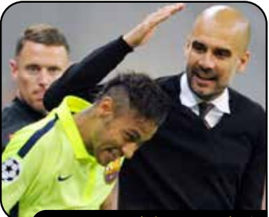
نیمار: پپ می‌خواست