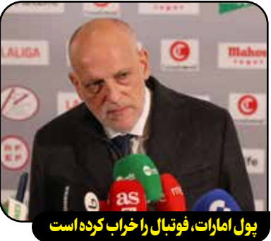
پول امارات، فوتبال را خراب کرده است

خاویر تبا، رئیس لالیگا اعلام کرد که این لیگ شکایتی رسمی به کمیسیون اتحادیه اروپا ارائه داده و مدعی شده که باشگاه منچستر سیتی قوانین رقابت اتحادیه اروپا را نقض کرده است. تبا توضیح داد که این شکایت در سال ۲۰۲۳ ثبت شده و به مقررات یارانه‌های خارجی مربوط می‌شود. این مقررات به یارانه‌هایی که توسط کشورهای غیرعضو اتحادیه اروپا به شرکت‌های فعال در بازار داخلی این اتحادیه پرداخت می‌شود، مرتبط است. لالیگا این شکایت را بر این اساس مطرح کرده که باشگاه منچستر سیتی از امارات متحده عربی یارانه‌های خارجی دریافت کرده که این موضوع باعث تقویت جایگاه رقابتی این تیم و ایجاد اختلالات گسترده در بازارهای ملی و اتحادیه اروپا شده است. تبا در این باره اظهار داشت: «آنها فقط به این فکر می‌کنند که چگونه می‌توانند قوانین و مقررات را دور بزنند. ما این موضوع را همراه با اسناد و ارقام به اتحادیه اروپا گزارش داده‌ایم. چرا! چون سیتی یک باشگاه انگلیسی است که عضو اتحادیه اروپا نیست، اما فعالیت‌های تجاری در اروپا دارد. پولی که از امارات واریز می‌شود رقابت را خراب کرده است.»