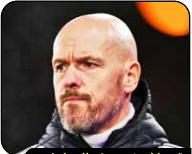
تن هاخ، منچستر ۶ سال جام نبرده بود، من آنها را قهرمان کردم

اریک تن هاخ فصل ۲۵-۲۴ را روی نیمکت منچستریونایتد آغاز کرد اما در نهایت به دلیل نتایج ضعیف، شغل خودش را از دست داد. طی یک مصاحبه جدید با SEG Stories، تن هاخ در مورد دورانش روی نیمکت شیاطین سرخ گفت: «دوران حضورم در منچستریونایتد را بسیار دوست داشتم. فوتبال انگلیس و هواداران که به تیمشان وفادار و متعهد هستند را بسیار پسندیدم. از این بابت سپاسگزارم. منچستریونایتد شش سال جامی نبرده بود و دو جام برای باشگاه به ارمغان آوردیم. هر زمان که در خیابان های منچستر قدم می زد، احساس قدردانی و محبت را از هواداران دریافت می کردم. آنها از قهرمانی در جام حذفی بسیار خوشحال بودند. پیروزی مقابل بهترین تیم جهان (اشاره به شکست منچسترسیتی در فینال) فوق العاده بود.»