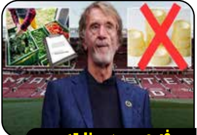
صرفه‌جویی در یونایتد به سبزی خوردن رسید!

مکتوس کارلسن، شطرنج‌باز ۳۴ ساله نروژی و شانزدهمین قهرمان جهان اعلام کرد شلوار جینی که به دلیل پوشیدن آن از مسابقات جهانی سریع محروم شد را به حراج گذاشته است. کارلسن در صفحه اجتماعی خود نوشت: شلوار چین ممنوعه، حالا می‌تواند برای شما باشد! شلوار چینم را به حراج می‌گذارم؛ جمله‌ای که هرگز فکر نمی‌کردم بنویسم. تمام عواید حاصل از این حراجی به برنامه‌های خیریه اختصاص خواهد یافت.