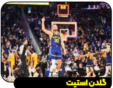
گلدن استیت با ارزش‌ترین تیم NBA

بر اساس دستور جدید باشگاه، به کارکنان بخش اجرایی باشگاه دستور داده شده که از این پس کارت‌های پیچ و مهره‌هایی را که برای تعمیر صندلی‌های ورزشگاه مورد نیاز است، دانه به دانه بشمارند تا مبادا حتی یک کارت‌نویس اضافه سفارش داده شود. گویا رئیس شیاطین سرخ اخیراً بازدید از انبار مواد مصرفی باشگاه داشته و متوجه شده که مقادیری چسب نواری اضافه وجود دارد و دستور عودت آنها را داده است. او همچنین به مدیر خرید باشگاه دستور داده که از این پس، در خرید سبزیجات مورد نیاز آشپز باشگاه برای تهیه غذای کارکنان و بازیکنان نیز دقت بیشتری به خرج دهد تا مبادا بیشتر از حد نیاز سفارش داده شود.