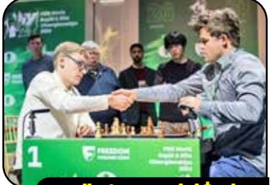
حراج شلوار چین جنجالی کارلسن

مکتوس کارلسن، شطرنج‌باز ۳۴ ساله نروژی و شانزدهمین قهرمان جهان اعلام کرد شلوار جینی که به دلیل پوشیدن آن از مسابقات جهانی سریع محروم شد را به حراج گذاشته است. کارلسن در صفحه اجتماعی خود نوشت: شلوار چین ممنوعه، حالا می‌تواند برای شما باشد! شلوار چینم را به حراج می‌گذارم؛ جمله‌ای که هرگز فکر نمی‌کردم بنویسم. تمام عواید حاصل از این حراجی به برنامه‌های خیریه اختصاص خواهد یافت.