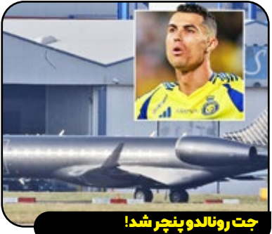
جت رونالدو پنجر شد!

هوایمپی شخصی فوق ستاره دنیای فوتبال، کریستیانو رونالدو در حال حاضر در فرودگاه منچستر متوقف شده است. دلیل این توقف، ترک خوردگی یکی از شیشه‌های این جت گرانقیمت گزارش شده است. براساس گزارشی که روزنامه سان منتشر کرده، تا زمانی که این نقص فنی برطرف نشود و تعمیرات لازم انجام نگردد، هوایمپا قادر به پرواز نخواهد بود. البته با ریخت و پاشی که سعودی‌ها برای رونالدو انجام می‌دهند بعید است رونالدو دغدغه‌ای بابت نداشتن جت شخصی داشته باشد.