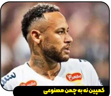
کمپین نه به چمن مصنوعی