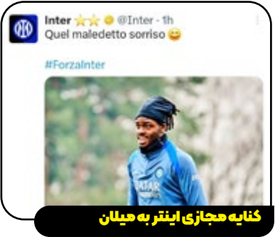
کتابه مجازی اینتر به میلان

میلان در بازی برگشت پلی‌آف چمپیونزلیگ به مصاف فاینورد و به تساوی ۱-۱ رسید اما به دلیل شکست ۰-۱ در بازی رفت، در مجموع ۱-۲ شکست خورد و از دور این رقابت‌ها کنار رفت. اینتر با انتشار پستی درست پس از سوت پایان بازی میلان و فاینورد، دیداری که باعث حذف روسونری از لیگ قهرمانان شد، در شبکه‌های اجتماعی سرورصد به پا کرد و نظرات متعددی را از طرف هوادارانش در ایکس دریافت کرد. اینتر پستی به همراه عکس یان بیسک در تمرین گذشته‌اش منتشر کرد و نوشت: «آن لیخت لعنتی.»