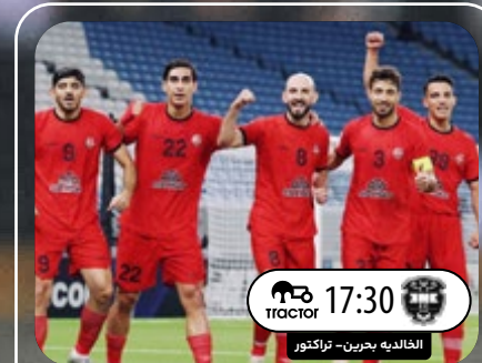
به دنبال مجوز صعود الخالدیه بحرين - تراکتور