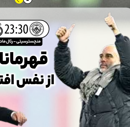
قهرمانان از نفس افتاده