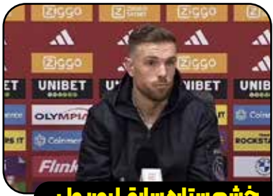
خشم ستاره سابق لیورپول