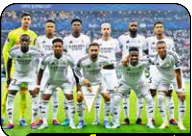
رئال مادرید پر درآمدترین