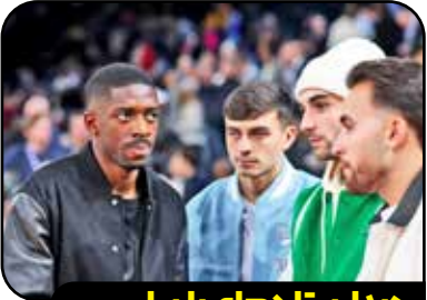
دیدار ستاره های بارسا