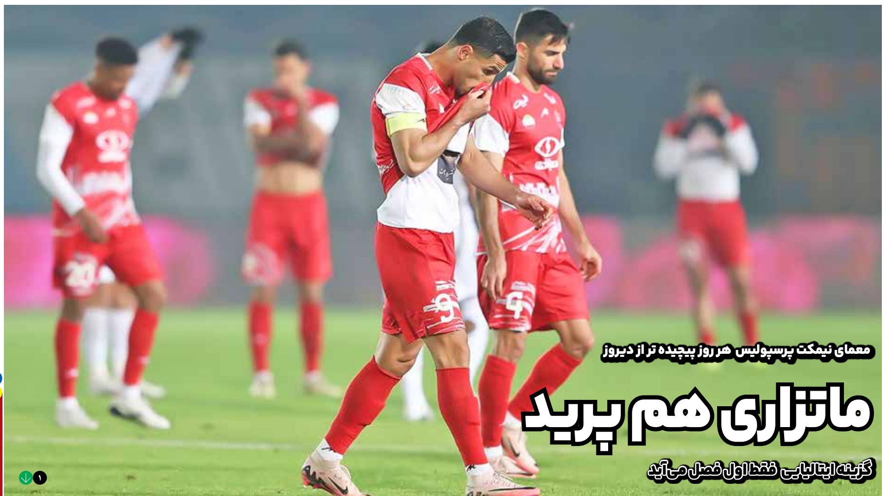
معمای نیمکت پرسپولیس هر روز پیچیده تر از دیروز