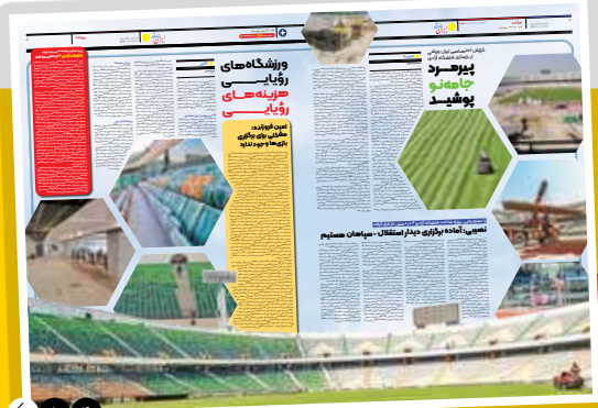
گزارش اختصاصی ایران ورزشی از بازسازی ورزشگاه آزادی پیرمرد جامه نو پوشید