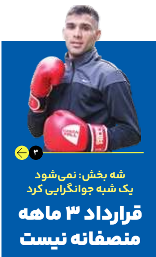
شه بخش: نمی شود یک شبه جوانگرایی کرد قرارداد ۳ ماهه منصفانه نیست