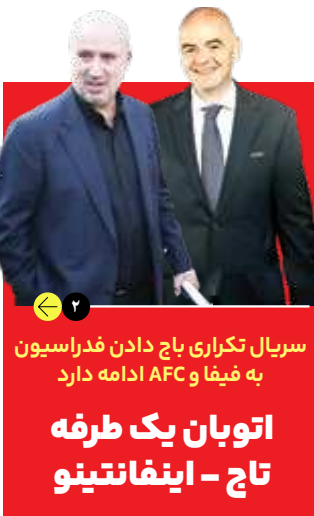
سریال تکراری باج دادن فدراسیون به فیفا و AFC ادامه دارد اتوبان یک طرفه تاج - اینفانتینو