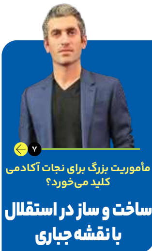
مأموریت بزرگ برای آکادمی کلید می خورد؟ ساخت و ساز در استقلال بانقشه جباری