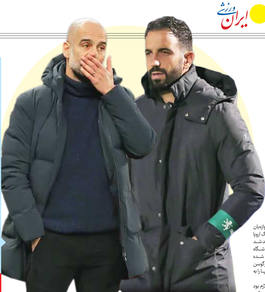
پپ در اندیشه انتقام از آموریم

انزو مارسکا شاید قطعه آخر پازل چلسی بود و توانست یک تیم پر مهره و ناآرام را جمع و جور و به ماشین پیروزی تبدیل کند. براساس آمار، میانگین سنی فهرست بازیکنان چلسی ۲۳/۴ سال است که بیش از یک سال از تیم دوم این جدول یعنی برایتون جوانتر است. اصلاً برای همین به سراغ