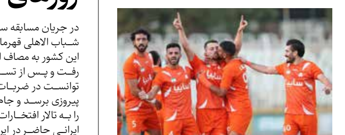
سایبا با اسکورت از ورزشگاه رفت