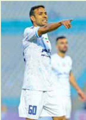
کرديم که باعث شد به خودمان بپاييم و در ادامه تمام تلاشمان را کردیم و به لطف خدا توانستیم با دو گل حریف را شکست دهیم.»

تیم گل گهرسیرجان در برابر حریف مدعی، یعنی تراکتور در جام حذفی توانست از سد تبریزی‌ها بگذرد و به مرحله بعدی رقابت‌ها صعود کند.