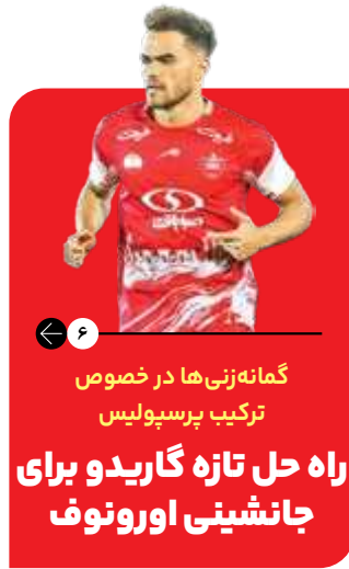
گمانه زنی ها در خصوص ترکیب پرسپولیس راه حل تازه گاریدو برای جانشینی اورونوف