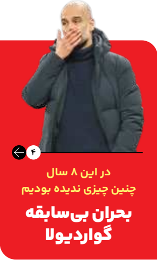
در این ۸ سال چنین چیزی ندیده بودیم بحران بی سابقه گواردیولا