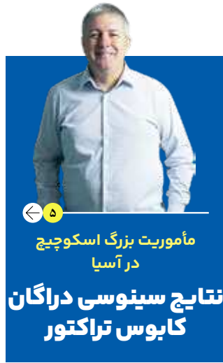
مأموریت بزرگ اسکوجیچ در آسیا نتایج سینوسی دراگان کابوس تراکتور